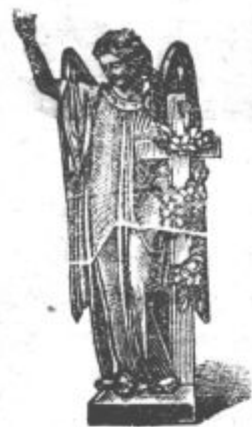
Brzojavlj: „Kamnoseška industrijska družba Celje“.