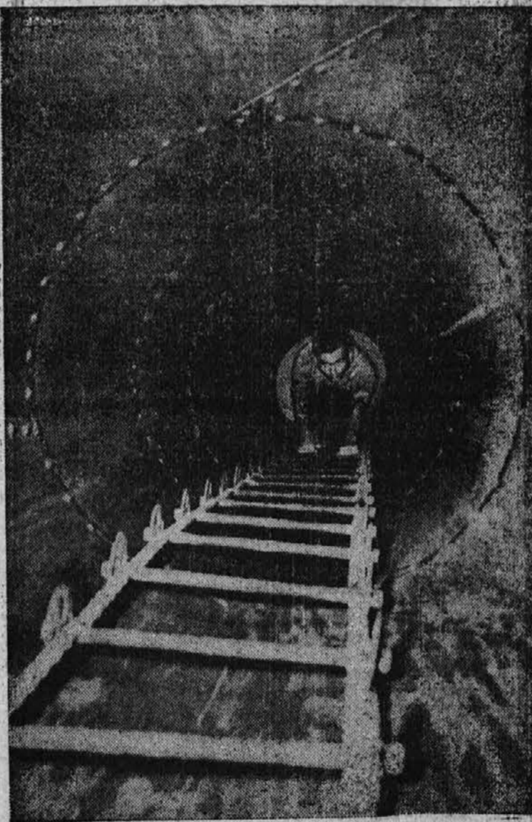
Po taki poti se rešijo mornarji, ki so zaposleni v stroj-oddelku ladje. Če bi bila njih ladja torpedirana, je to najbližja pot iz potapljačice se ladje.

Kadar vprašate za delo, ne pozabite omeniti, da ste videli tozadevni oglas v Ameriški Domovini