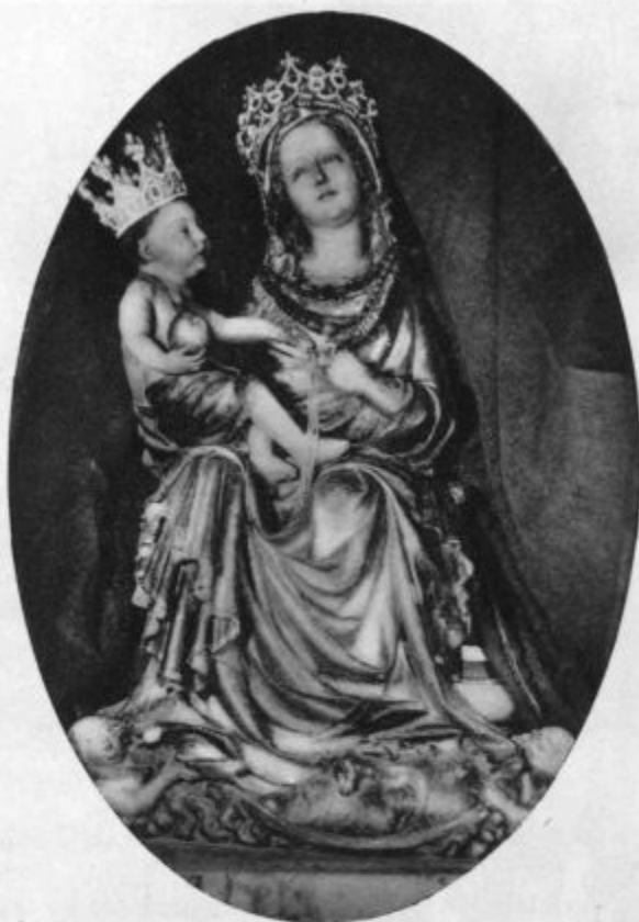
Milostna podoba v Gosposveti