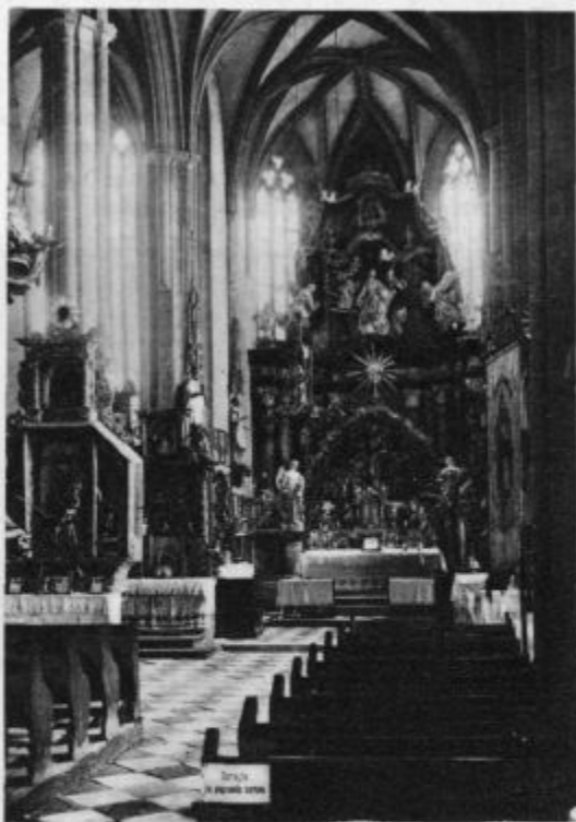
Veliki oltar cerkve na Ptujski gori. (Glej dopis v zadnji številki!)

Mesto se ji je nasmehnilo in čeprav so ji bile ulice tuje, obrazi lepi, se je čutila v vr-