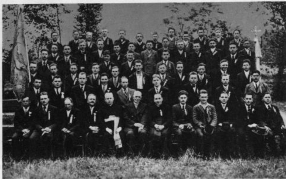
Fantovska Marijina družba — Smarje pri Jelšah

»Saj res, gospodična. Midva sva sama in vi ste sami. Treh nas ne bo sram in ne strah.