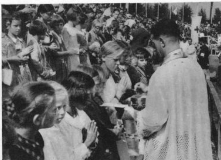
KKK: Angelski Kruh. (Sv. obhajilo mladine)

»Pravijo? Kdo to pravi! Ljudje seveda. Naj sodijo in govore ljudje kakor hočejo, ljudje sodijo po svoje, Bog pa po svoje. Ampak ljudska sodba! Gorje mu, kdor se nanjo zanaša! Pustimo sodbo o naših duhovnih voditeljih Bogu in glejmo v njih samo to, kakor uči apostol Pavel: 'Vsakdo nas imej za slu-