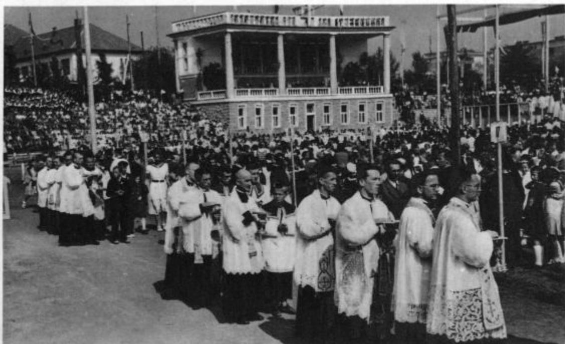
KKK: V pričakovanju sv. obhajila

veličastne zgradbe KA. Ni pa bilo sotrudnikom-začetnikom lahko delo, gledati svojega novega učitelja z očmi duhovnega gospoda očeta. Dokaj lažje se jim je zdelo z očmi sveta