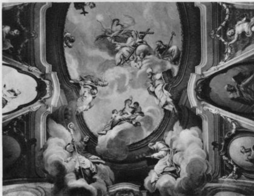
Quaglietteve freske na stropu semeniške knjižnice v Ljubljani. (Glej opis: Naše slike)