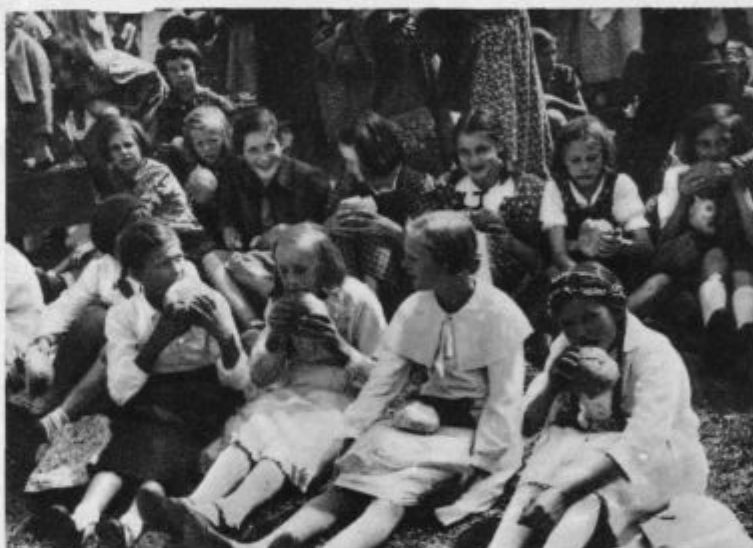
KKK: Telesni kruh. (Okrepčilo po sv. obhajilu)

žabnike Kristusove in za oskrbnike božjih skrivnosti.' Kdaj se bo svet spet navadil gledati v duhovniku to, kar mora v njem gledati in iskati, ne pa gledati v njem samo človeka z njegovimi vrlinami in slabostmi!«