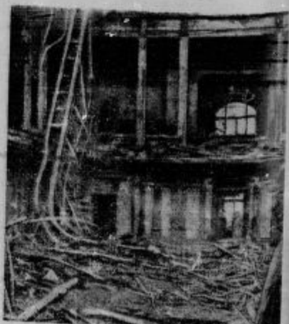
Razvaline v plenarni sejni dvorani po končanem požaru. Puščica meri v zgorelo ložo državnega predsednika.