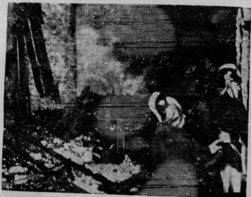
Razdejanja v plenarni sejni dvorani.