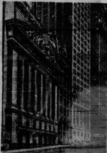
Pogled na Wallstreet v Newyorku, kjer je, kakor znano, središče ameriškega bančnega in borznega življenja. Bančna kriza v Združenju ameriških državnih se je tako poostрила, da so vse banke zaprosile za moratorij ali vsaj za začasno odgoditev izplačil.

Vsi obsojenci uživajo custodio honesto (dostojno zatvoritev).