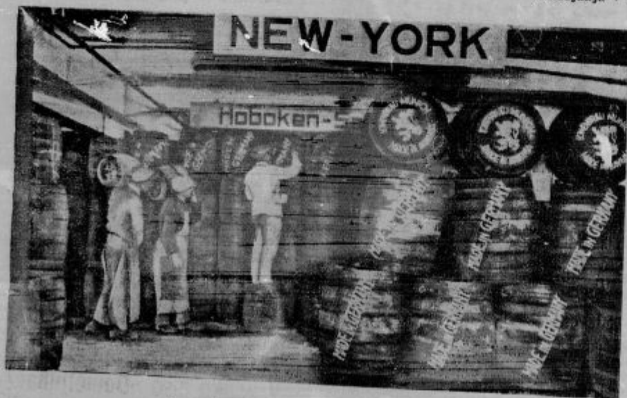
Iz monakovske pivovarne v Ameriko...