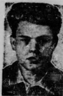
Nizozemec Van der Lubbe, ki je obdolžen požara nemškega parlamenta.