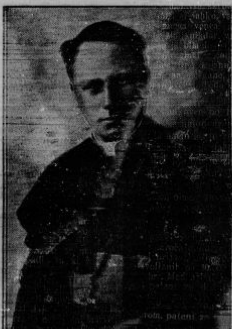
1883 — 1933

Malo časa vlada pravzapravi jubilačni ljubljanski škof, a vendar je v tem kratkem času pridobil srca vseh. Njegova ljudskost, preprostost in skromnost, njegova velika ljubezen do mladine, njegova apostolska gročanstvo, pa tudi junaška neustrašenost, kadar je treba braniti zaklade božjih resnic, ki so mu varstvo izročeni: vse to in še nešteto dru-