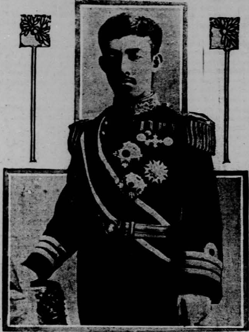
Slika nam kaže japonskega cesarja, ki je zadnji čas obolel na sladkorni bolezn.

Vsled te nesrečne politike se je ustvarilo povsem nemogoče meje, ki ne bodo imele končno za posledico nič drugega kot nadaljnje nemške aspiracije. da se vnovič razdeli Poljsko. Poraz Poljakov v vojni z boljševiki pa je dovedel do še bolj opasnega in kritičnega položaja na iztoku. Poljaki so skušali dobiti meje, kot so obstajale pred prvo razdelitvijo Poljske, ki se je završila leta 1772. Zapadni narodi, kojih zastopniki so bili zbrani v Parizu, pa so nasprotovali tem poljskim aspiracijam ter določili meje v razmerju, ki ni ugalajo poljskim aspiracijam. Vse to je pomenjalo, da niso zaveznički soglašali s poljskimi aspiracijami in da tudi niso bili Amerikanci ali Angleži za to, da bi predstavljala močna Poljska jez proti boljševičnemu napvalu. V položaju, v katerem so se nahajali Poljaki približno tako kot so neisprosnege stališča in končno storil potem, ko bili poraženi pri