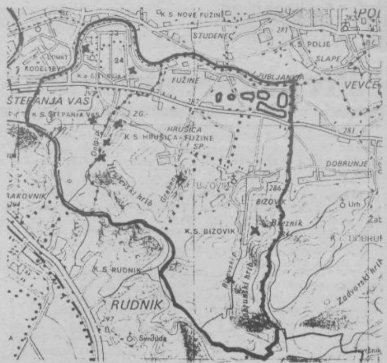
Pregledano območje: Manjša odlagališča so predstavljena s križci, večja z obrisi.