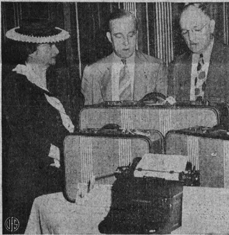
Okrog 1,800 vstopilcev delavskega departamenta je priredilo poslovilni večer za svojo "bossovko," tajnico tega departamenta Frances Perkins, ko se je poslovila iz tega urada. Kot darilo ali v spomin so ji dali $50 vojni bond, potovalne kovčke in pisalni stroj. Njen naslednik je zvezni sodnik Lewis B. Schwelienbech.