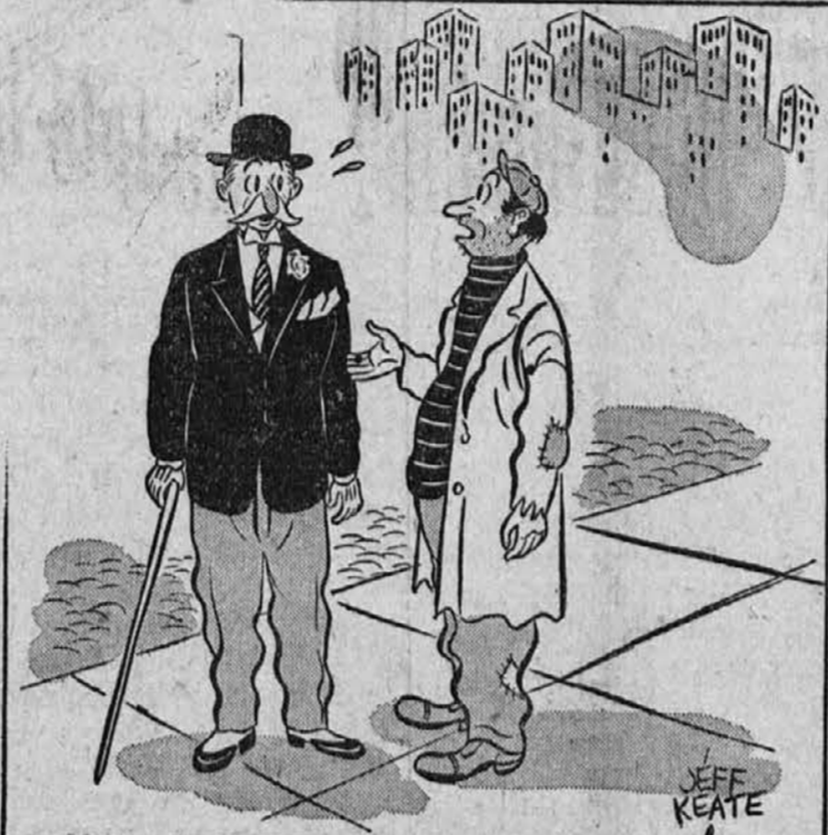
"Buddy, could you spare $18.85? I want to get a cup of coffee and a War Bond!"