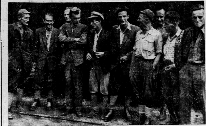
Odprava slovenskih alpinistov, ki je bila letos v francoskih Alpah.

»Kam pa zdaj?« me je vprašala dobra gospa. »V Salt Lake City,« sem rekel. »Tam imam sestro, omoženo sestro.« (Pomislim sem, ali naj jo napravim mormonko, kar pa sem rajši opustil.) »Njen mož je podjetnik.« Seveda sem dobro vedel, da podjetniki zvečine grobo zaslužijo. Ampak tako sem pač rekel. In to sem moral, če je mogóče, popraviti. »Saj bi mi bila poslala denar za pot, če bi jo bil poprosil.« sem razložil, stoda zadela ju je bolezen in nesreča v podjetju. Družabnik ga je oցiganiil, zato nisem hotel pisati in prositi za denar. Vedel sem, da bom že kako prišel tja. Pustil sem jo v veri, da imam dovolj za pot v Salt Lake City. Tako dobra in ljubezniva je, vedno je bila dobra z menoj, upam, da me bo svak vzel v uk in da bom pozneje stopil v njegovo podjetje. Dve hčerki imata, obe sta mlajši od mene, ena je še čisto majhna.« »Izmed vseh omoženih sester, kolikor sem jih raztresel