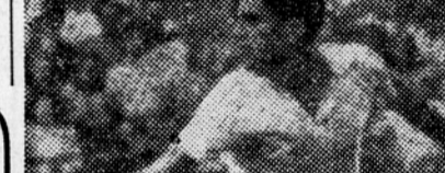
Američan Dick Savitt

Na tekmovalju za prvenstvo Novega Južnega Walesa je Avstralec Harvyn Rose premagal zmagovalca v tekmovalju za wimbledonski pokal Dicka Savitta v petih setih (3:6, 6:1, 2:8, 7:5, 6:4). Amerikanec Ted Schöder je premagal Avstralec Ken Mc Gregorja s 5:7, 4:6, 6:2, 6:3, 7:5. Ted se bo pomeril v pol-