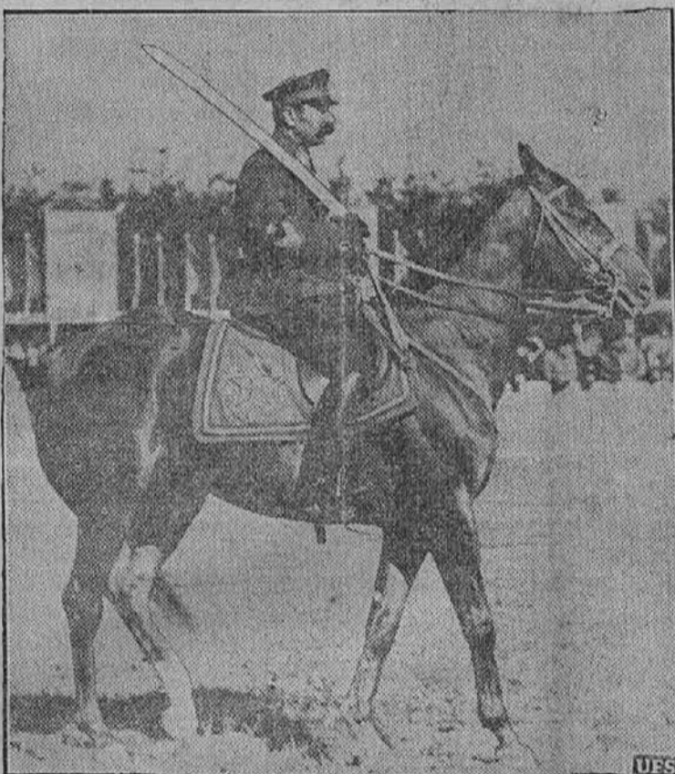
Maršal Simon Budenny, poveljnik ruske armade v moskovskem okrožju, nosi ogromen meč mesto maršalske palice, v znak svoje časti. Budenny zelo sliči diktatorju Stalinu.

se odda. Zgorej dve sobi, pravno za malo družino, in pa tri sobe. Gorka voda in kopalnice, pripravno za novoporočence. Poizve se na 1133 Norwood Rd. (251)