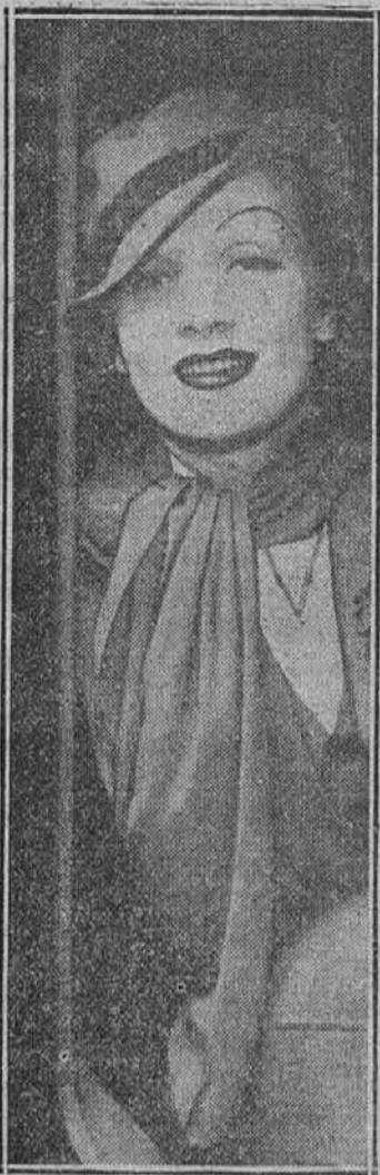
Marlene Dietrich, filmska zvezda, rodona iz Nemčije, je zdaj zaprosila za ameriško državljanstvo, radi česar jo nemško časopisje v Berlinu ostro prijema. Marlene je stara 33 let. Njen oče je bil častnik v nemški armadi in je padel v svetovni vojni.

Tema je bila, z baklami smo svetili. Konji so bili nemirni, begali so po dvorišču.