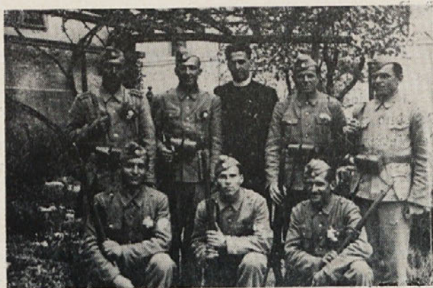
Fantje iz Sv. Križa pri Litiji — domobranci na postojanki na Vrhniki.

dovščino in so se začeli skupaj z drugimi enotami umikati proti Gorici in naprej v Italijo. 1. maja so se srečali z Angleži v Furlaniji. Odpejani so bili v taborišče v Palmanovo. Orožje so morali odložiti 5. maja.