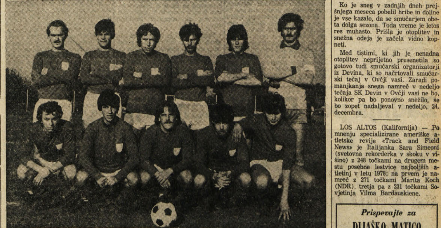
Nogometna enajsterica bazoviške Zarje se je v dosedanjem delu prvenstva 2. amaterske lige res izkazala

Vido je samo za trenutek zmedlo. Že si je opomogla in že je začela mimo tega: