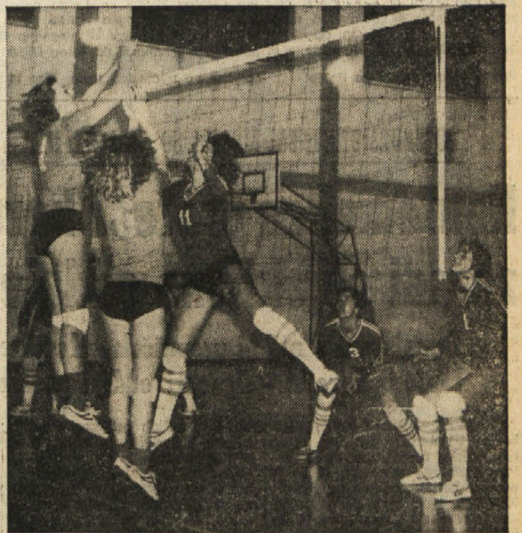
Borovke med svojim ligaskim nastopom proti Pordenončankam