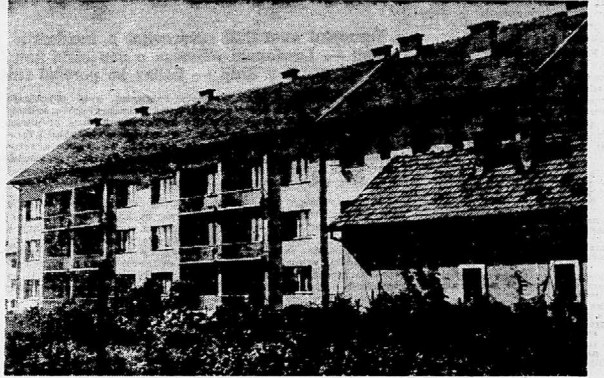
Uspehi samoupravljanja pri skrbi za človeka — 20 družinskih stanovanj

prispevek za nego po 25 oziroma 50 dinarjev na dan od osme-dne dalje, ko je postal učenec ali dijak neposoben za šolsko delo — največ za 100 dni. Kakršna koli odškodnina iz zavarovanja šolske mladine je v popolni neodvisnosti od morebitnih davkov socialnega zavarovanja. Če je zdravljenje brezplačno iz naslova socialnega zavarovanja, se izplača prispevek za nego. Učenci in dijaki socialnega zavarovanja ali nezavarovanih staršev so torej v svojih pravihah popolnoma izenačeni — zavarovanje je za ene kot druge enako koristno in potrebno. Zato je koristno, da starši in vzgojitelji razmislijo o potrebni zaščiti šolske mladine!