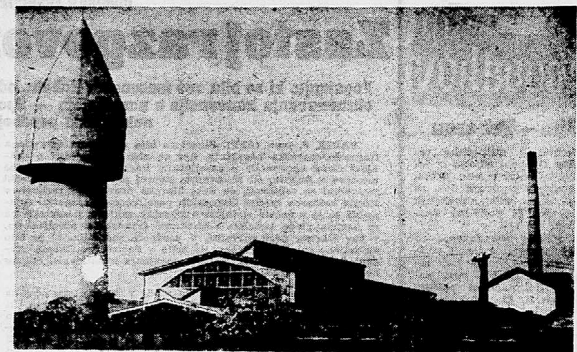
Tovarna kleja v Ljubljani

Tretja stvar, ki jo namerava tovarna začeti v bližnji prihodnosti, je proizvodnja visokovrednih izdelkov, zlasti želatine za prehransko industrijo in široko potrošnico, fotoželatine in še nekaterih drugih izdelkov. Za uresničitev vseh teh načrtov pa je treba strokovnih kadrov, izkušenj in denarja. Kadre in izkušnje tovarna ima, potrebuje le denar. Tega se pa izplača investirati, saj je proizvodnja želatine ena izmed zelo donosnih.