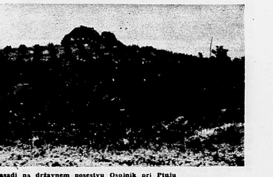
Brekovi nasadi na državnem posestvu Osojnik pri Ptuj

Cilj naših proizvodnih setev-nih preizkušanj z mnogimi italijanskimi in avstrijskimi sortami je bil in je še naprej ta, da z najbolj ustreznimi agrotehničnimi ukrepi najdemo