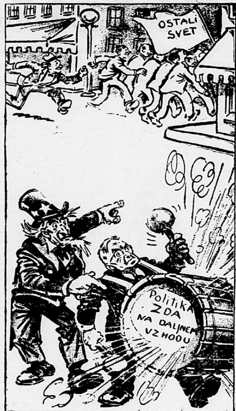
(Poinier v »The Detroit News«)

V Londonu menijo, da je vlada dobila na znanje, da ne more računati na sodelovanje sindikatov v boju proti inflaciji celo niti po neodvisnem posvetovanem telesu, ki je bilo ustanovljeno pred kratkim. To pomeni, da se bodo zaostrili odnosi med sindikati in vlado, hkrati pa tudi razmerje med vlado in opozicijo.