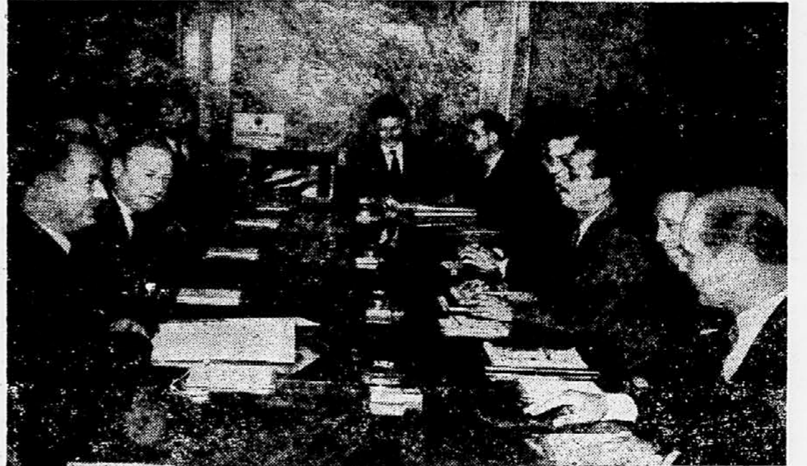
Med jugoslovansko-britanskimi političnimi razgovori v državnem sekretariatu za zunanje zadeve

so državniki obeh držav govorili v glavnem o mednarodnih problemih: O razorožitvi; odnosih med Vzhodom in Zahodom, problemu evropske varnosti in položaju na Bližnjem vzhodu. Zastopniki obeh držav se strinjajo v tem, da se je treba nenehno truditi za zboljšanje mednarodnega položaja. V razgovorih so poudarili ugoden in uspešen razvoj prijateljskih zvez med FLRJ in Veliko Britanijo. Te zveze so v veliko korist tako za nadaljnji razvoj prijateljskega sodelovanja med državama kot za mir in sodelovanje na svetu sploh.