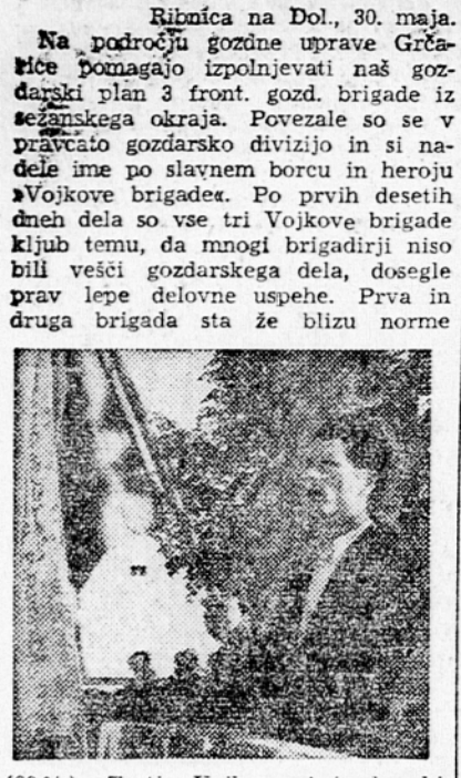
Ribnica na Dol., 30. maja. Na področju gozdarstva so se v predčasi gozdarski divizion in si nadle ime po slavnem borcu in heroju Vojkove brigade. Po prvih desetih dneh dela so vse tri Vojkove brigade kljub temu, da mnogi brigadirji niso bili večji gozdarskega dela, dosegli prav lepe delovne uspehe. Prva in druga brigada sta že blizu norme

Sklep Vojkovih frontnih gozdarskih brigad ob prejemu prehodne zastavice