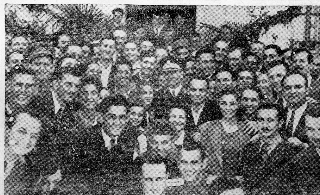
Maršal Tito je sprejel ob sv ojem rojstnem dnevu zastopnike delovnih kolektivov iz Beograda

V nekaterih socialističnih državah se pojavljajo birokratske tendence, ki nastopajo praktično proti temu načelu. Te tendence se izražajo v tem, da volivnost vodilnih uslužbencev vedno bolj omejujejo, da prenašajo čim več funkcij in upravnih organov na uslužbence, imenovane po višjih upravnih organih. Take tendence so se pojavljale tudi pri nas, toda mi smo jih razbili prav v začetku. Pri nas ne volimo samo izvršnih odborov ljudskih odborov, temveč so tudi na čelu posameznih panog uprave izvoljeni zaupniki. Na ta način smo načelo socialistične demokracije