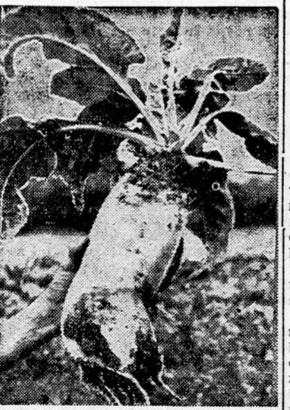
Ponos zadržim ekonomije: 4 kg težka krmska pesa