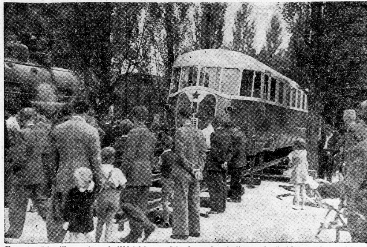
V zvezi z železniško razstavo ob 100 letnici prve železnice v Jugoslaviji so ob tivolskem parku v Ljubljani razstavili najstarejše in najmoderneje lokomotive in vagon. Na sliki vidimo motorni vagon za prevoz potnikov, ki se ga izdelali v mariborskih železniških delavnicah