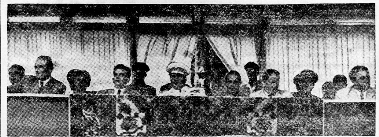
Maršaj Jugoslavije Josip Broz-Tito prisostvuje na častni tribuni balkaniadi mu prvenstvu v vajah na orodju