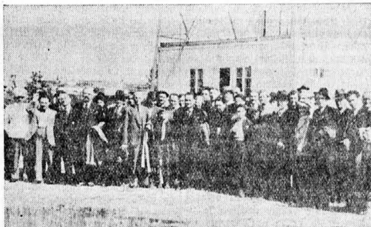
Članovi plenuma Savezne uprave Sokola K. J. na beogradskom aerodromu