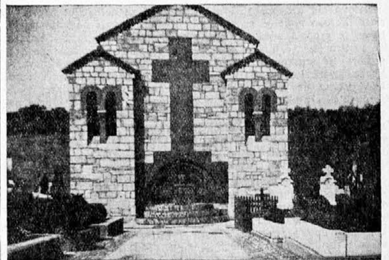
Спомен-капела видовданских херојима, у Сарајеву

Sokolstvo ne sme i ne može da priznaje privilegije, jer je naš vaspitni rad upeoren protiv svakoga protekcionizma i iskorišćavanja. Hoćemo, da savesno podiže-