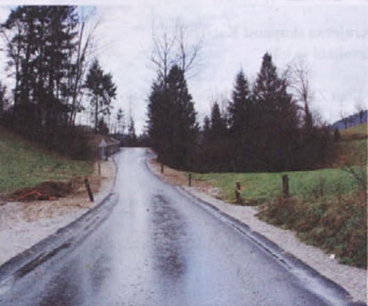
Asfalt na prvih dveh tretjinah ceste Malenšek – Petač v KS Preska.

Konec oktobra je bila asfaltna prevleka položena na cesti Malenšek – Stežica – Petač in v začetku novembra na delu ceste proti vrhu Osolnika.