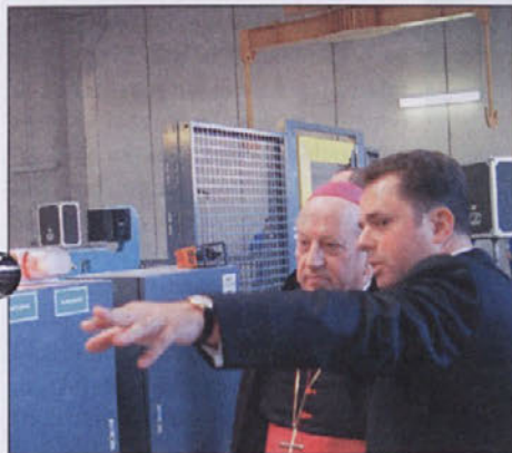
Na slovesnosti je bil tudi nadškof in metropolit dr. Franc Rode.

V Goričanah, tovarni papirja Medvode, so 7. novembra uradno odprli novo proizvodno halo in simbolično predali v uporabo vzdolžno rezalni stroj in pakirno linijo v skupni vrednosti 7,5 milijona evrov. Tik pred tem je bila podpisana pogodba o prodaji večinskega deleža Slovenske razvojne družbe v likvidaciji za dobrih 6 milijard tolarjev podjetju Papigor Holding, d.d., Medvode.