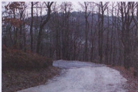
Asfalt počasi prekriva makadam na cesti proti vrhu Osolnika.

Eden večjih tovrstnih zalogajev, vsaj kar se višine potrebnih sredstev tiče, je bila letos ureditev