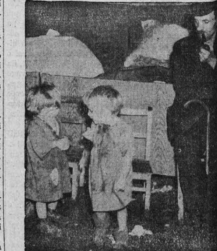
Skoro kot doma. — Dva raztrgana otročička pazni oče so del skupine 1.700 nemških beguncev zbežali iz svojih domov v Saarlautern v Nemčiji selili v nekem zapuščenem rudniku. Ko jim je zapovedala, da morajo zapustiti svoje domove, so najpotrebnejše pohištvo in odšli v pozemeljsko Osvobodila jih je šele naša 3. armada, ko je pokrajino.

ZENSKÉ SUKNJE Naročite si fini FUR-COAT ali Sterling sukne volnena blaga direktno iz tovarne po veliko kakor kje druge na WILL-Call pri BENNO B. LEUSTIG-U ENdicott 3426 1034 A