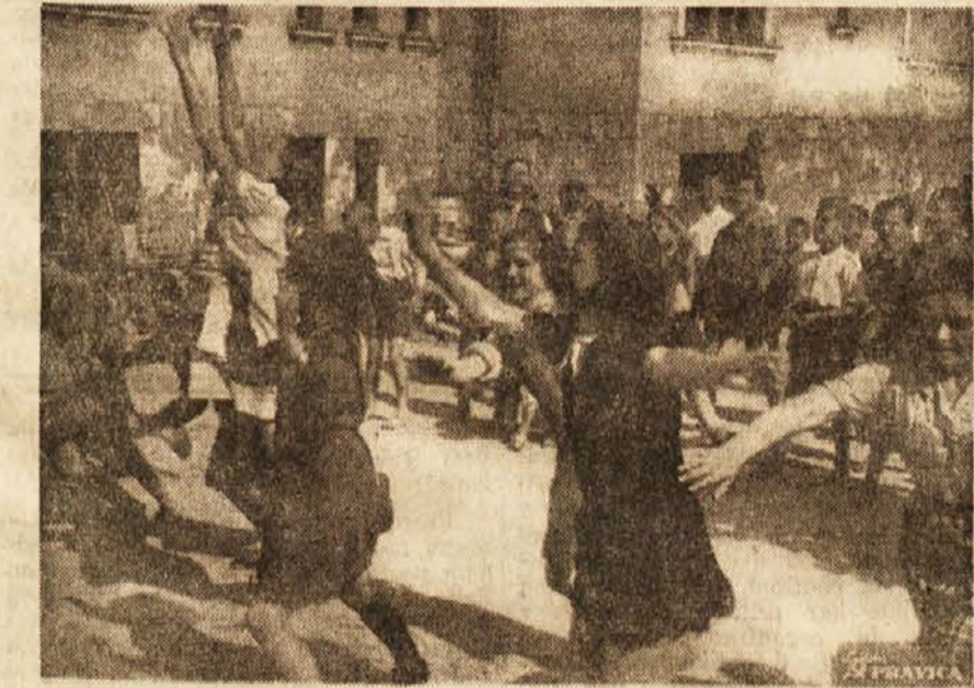
Otroci iz doma Titovih pionirjev v Mostah pri igri z žogo

Zaradi važnosti tega tedna pozivamo vse prebivalstvo mesta Maribora, da se navedenih prireditve v čim večjem številu udeležijo in s tem doprinese svoj delež za čim boljše rešitev vprašanja socialne in zdravstvene zaščite matere in otroka.