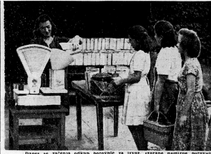
Danes se začneja odkup borovnic za izvoz. Izbrane namizne borovnice odkupujejo kmetijske zadruge po 50 din kg.