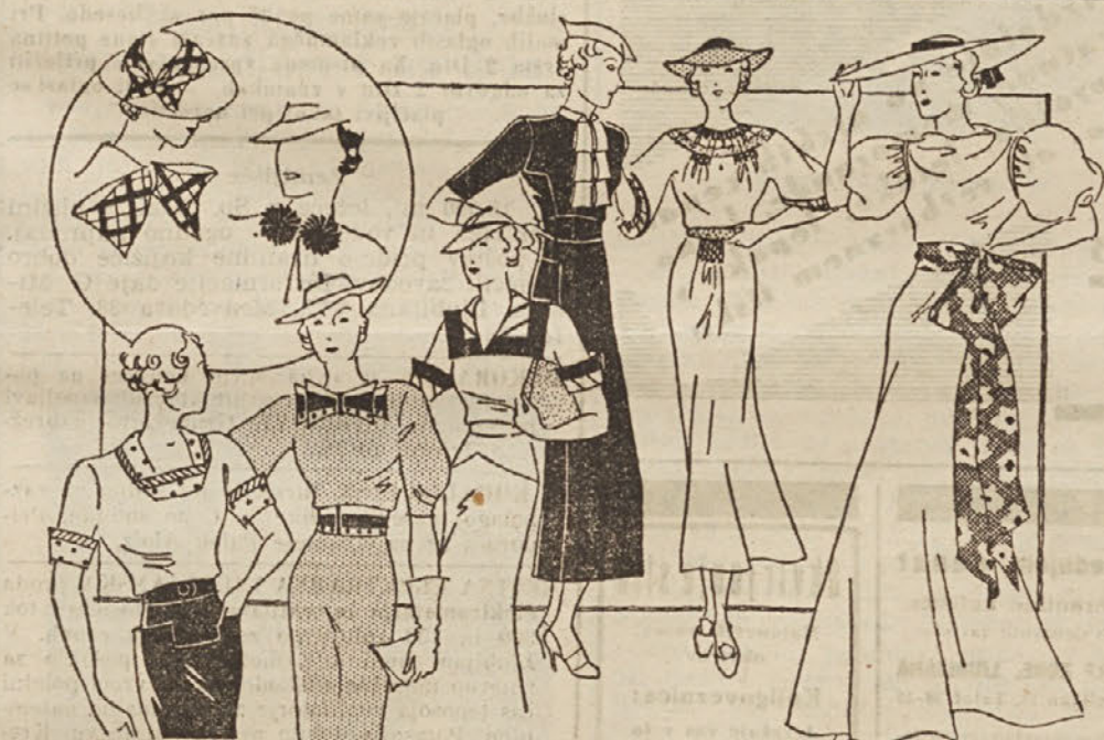
Trakovi plapolajo na pokrivalu in oblačilih Poleg cvetja in čipk so trakovi najbolj priljubljeni atributi današnje mode. Slika nam kaže vsestransko uporabnost trakov.

1. c4, e5; 2. Sf3, Sc3; 3. Lb5, a6; 4. La4, Sf6; 5. 0-0, Sxex4 (nastane živahna igra s figurami. Težak in soliden sistem je Čigorinov z Le7; 6. Te1, b5; 7. Lb3, d6; 8. c3, Sa5; 9. Lc2, c5 itd.; često se igra tudi d6) 6. d4 (moćnejše kot 6. Te1, Sc5), b5; 7. Lb3,