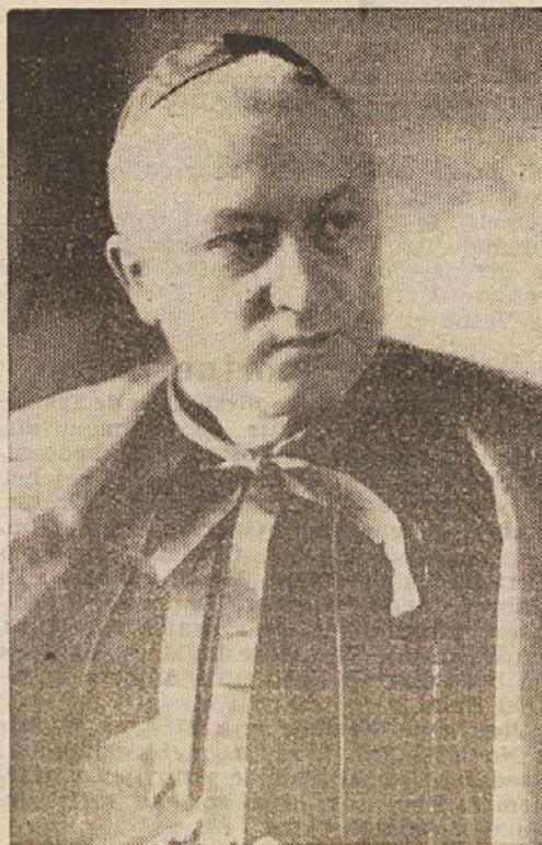
Kardinal dr. Avgust Hlond, primas Poljske, ki bo zastopal sv. očeta na evharističnem kongresu v Ljubljani.

Strasen pok na dvorišču. Tresem se ko šiba, mogoče manj zaradi strahu, kakor zaradi napetosti. On ne trene z očmi. Tudi ne takrat, ko se nad streho razleti šrapnel in ropoče po zlebovih, kakor bi stresal orehe. Čutim, da tega dneva ne preživim. Kljub temu, da smo sredi zime — večeraj so bili