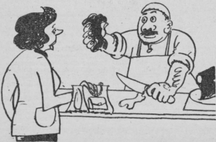
— Veste, da je v enem samem gramu zmletega mesa sto milijonov bakterij? — Larifari! Kar pogledajte ga, če najdete eno samo vam ga dam zastoj! (Pavliha)

Pri prodaji živil je najpomembnejša higiena osebe, ki jih prodaja. Zal pa pogoji v naših mesnicah še zdaleč niso taki, da bi lahko zagotovili neoporečno higieno. Garderobne omarice so neprimerne, delovni