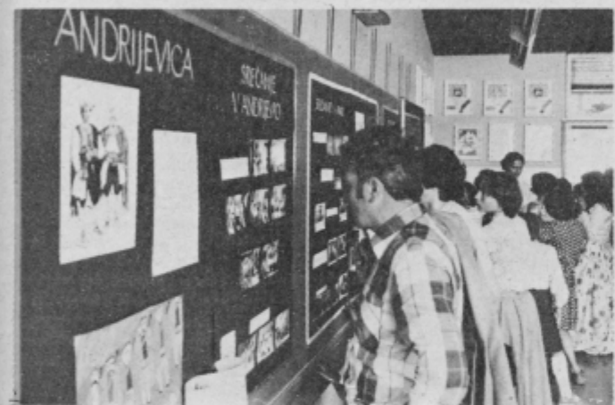
Na razstavi so obujali spomine na pretekla srečanja.

Tako so pripovedovali učenci pobratenih šol. Vseh predstavnikov sploh nismo uspeli povabiti na razgovor, saj je bilo po nastopu toliko dela in priprav na družabno srečanje, pa pogovoriti so se morali o tolikih stvareh, da ni bilo časa za vse. Vsi so se strinjali, da je bilo srečanje v Podlehniku zares prijetno doživetje za vse — le prehitro je minilo. Želijo si, da bi se še kdaj srečali, da bi vezi, ki so nastale na letošnjem srečanju ostale in postale vse bolj tesne, veseli in srečni so, ker so mladi...! N. D.