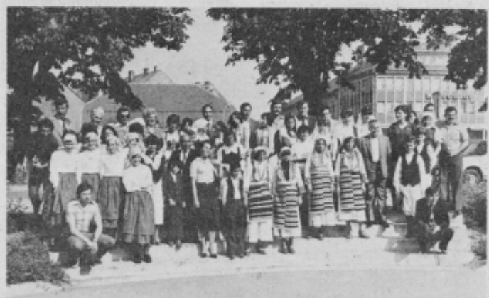
Skupinski posnetek za spomin na srečanje v Sloveniji.

imamo pa precej krožkov. Naj naštejem nekatere: biološki, kemijski, matematični, srbskohrvatski, recitacijski, literarni, folklorni krožek, imamo tudi pevski zbor. Sodelujem v folklornem in recitacijskem krožku. V Sloveniji