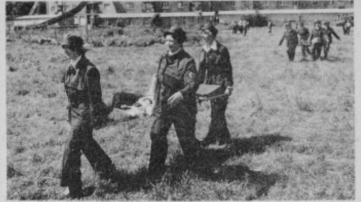
Ekipa civilne zaščite za prvo medicinsko pomoč