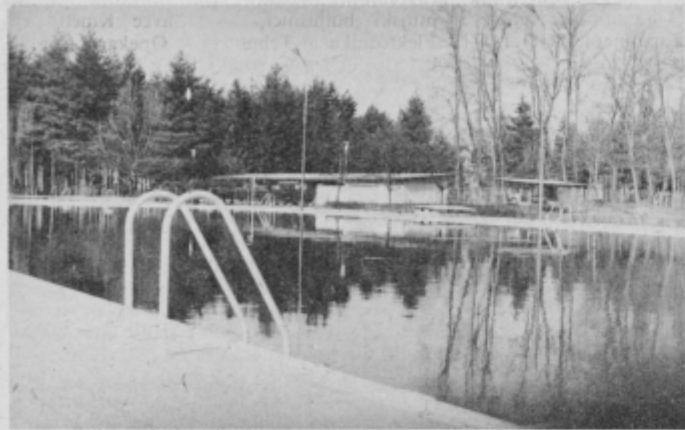
Pogled na urejen olimpijski bazen v Kidričevem.

Ko smo v eni prejšnjih števil Teknika poročali o tem, v kakšnem stanju je bilo kopalniško v Kidričevem (olimpijski bazen), pa danes lahko pohvalimo vse tiste, ki so se trudili in po daljšem času usposobili kopalniško oz. največji kopalni bazen v Kidričevem za normalno uporabo.