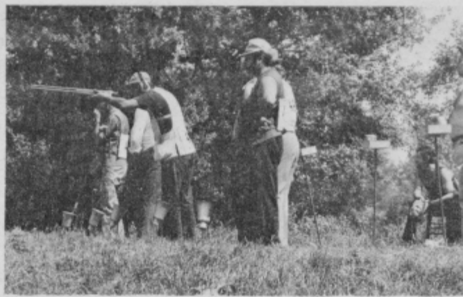
Strelišče ob Pinčrjevem mlinu je bilo to nedeljo zelo živahno.