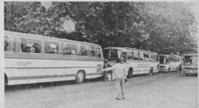
Pred odhodom avtobusov s Trga svobode v Ptuj, ko so odpeljali na izlet 396 krajanov, starih nad 70 let, najstarejši pa je bil Lovrene Metličar iz Gereče vasi, 94 let in je zagotovil, da se bo prihodnje leto še udeležil podobnega izleta

Na poti domov smo se ustavili v Velenju, kjer je bilo kosilo in tudi drugače veselo in zabavno v igro »maček v žaklju«, za kar so darila