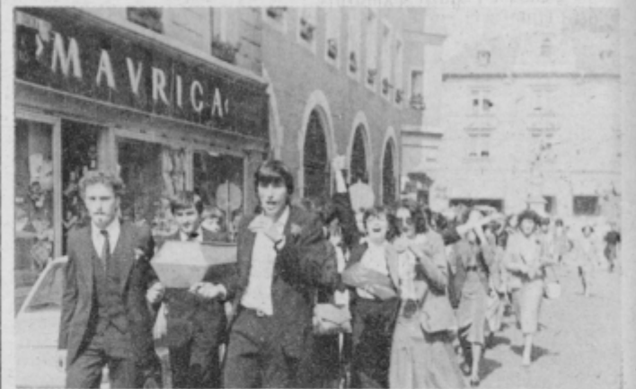
Maturanti na ptujskih ulicah