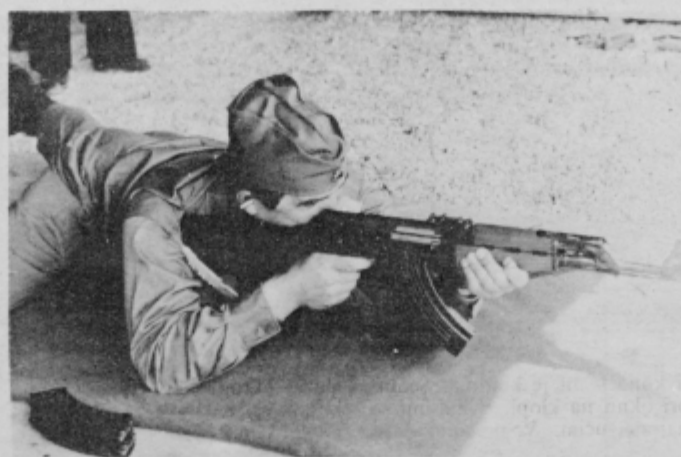
Streljanje z avtomatsko puško