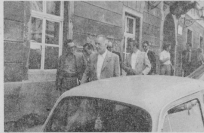
Po obisku v DO Mercator Izbira Panonija.