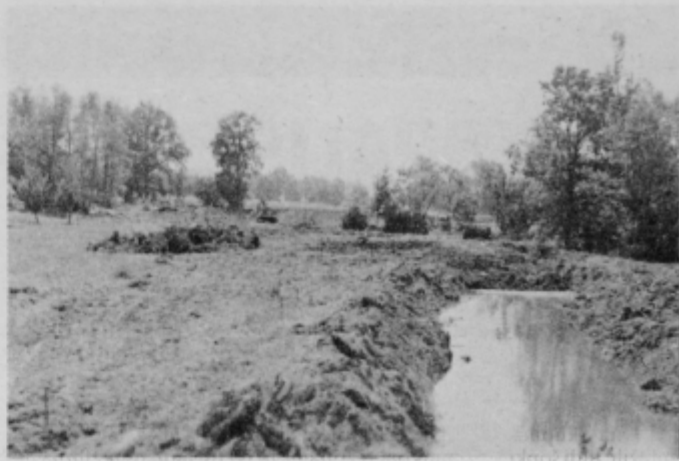
Urejanje Polskave pri Pragerskem

morem dati, vendar bo akumulacija pri Medvedcah na približno 70 ha, pri Požegu pa nekoliko manj. Če pogledamo količino vode, bo v zadrževalniku Požeg zadržanih približno 1700.000 kubičnih metrov vode, vode s padavinskega območja pa se bo zajelo okrog 26 kvadratnih kilometrov.