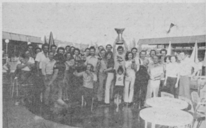
Zmagovalna ekipa ERC iz Ljubljane in drugovrščna ekipa Emona Mercur Ptuj s pokali