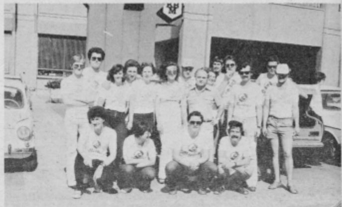
Ekipa Emona Mercur Ptuj pred startom