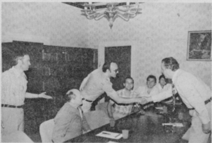
V torek dopoldan so člani delovne skupine obiskali najprej komite OK ZKS Ptuj.