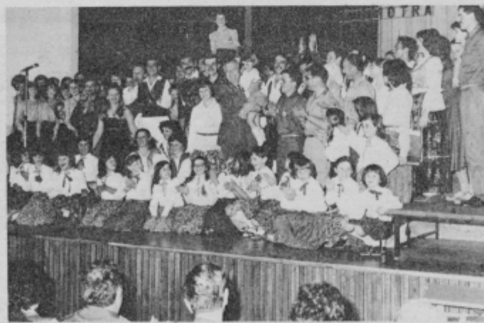
Mladi in vojaki na skupnem nastopu