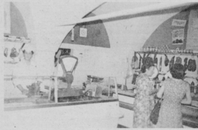
Mesnica Kmetijskega kombinata v Murkovi ulici oskrbuje z mesom lokale Haloškega bisera, je najbolj obiskana, vendar ne izpolnjuje higienskih in sanitarno-tehničnih pogojev.

Dosedanja vlaganja v mesnice so bila v pretežni meri vlaganja v ureditev prodajnega prostora in deloma hladilnic. Dosti manj ali skoraj nič pa ni bilo vloženo v ureditev pomožnih prostorov, predvsem za zaposlene. Za vse mesnice je značilno pomanjkanje garderobnih in sanitarnih prostorov. Za lastnike mesnic pomeni upoštevanje predpisov večje gradbeno-tehnične posege. Večina osmih mesnic je v starih zgra-