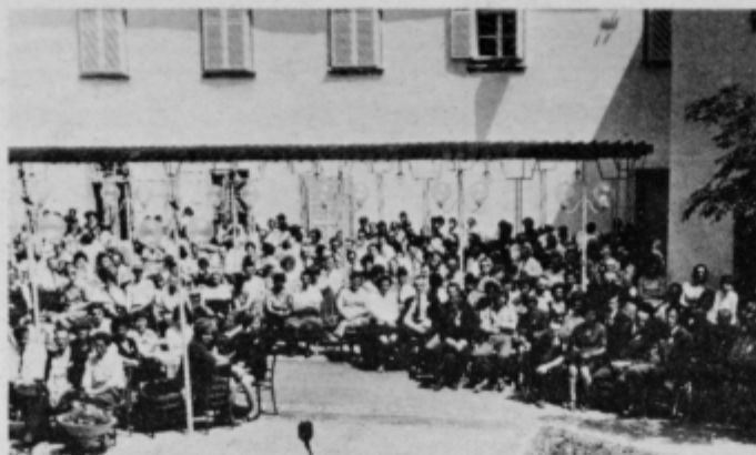
Na prvem „dnevu perutinarjev“ leta 1972 se je zbralo na Borlu okrog 500 perutinarjev.

20 leti iskalo kruh v Perutnini le okrog 120 delavcev, sedaj pa združuje delo v tem kolektivu prek 1200 delavcev in čez 400 kooperantov. Razumljivo je, da so v tako velikem kolektivu, ki je organiziran v več TOZD, delavci več ne poznajo med seboj. Ker pa so za dobro delo pomembni in nujni tudi dobri medsebojni odnosi, organizirajo v ptujski Perutnini različne oblike zblizevanja članov te delovne organizacije. Pri tem imajo pomembno mesto delavske športne igre, ki jih organizirajo v okviru delovne organizacije. Ta oblika športne rekreacije združuje vedno več delavcev vseh TOZD, vendar opažajo, da se jih vključuje še vedno premalo. Tudi preživljanje dopusta delavcev vseh TOZD v skupnih počitniških hišicah je način medsebojnega spoznavanja. Najpomembnejši pa je vsakokrat vsakoletni Dan perutinarjev, ki že postaja pravi delovni praznik za ta kolektiv.