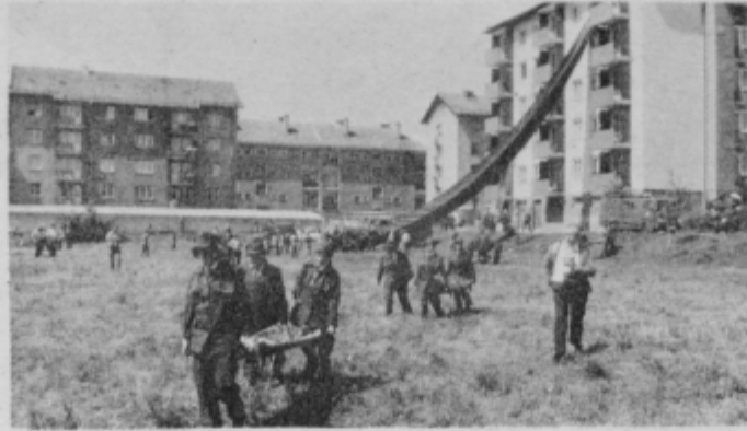
Z vaje enot civilne zaščite v KS Jožeta Potrča Ptuj