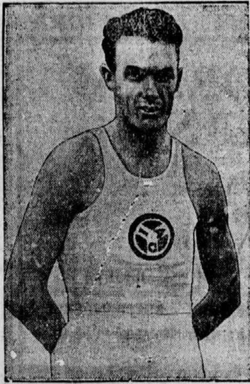
Ist der Amerikaner Conger, der im Meilenlauf im New Yorker Madison-Square-Garden den Finnländer in einer Zeit von 4:17,4 mit sieben Meter Vorsprung schlug.

Morpurgo gewinnt das Carlton-Tennisturnier. Gestern wurde in Cannes das große Carlton-Tennisturnier erledigt. Im Dameneinzel siegte Miß Bennett gegen Miß Boyd 6:4, 5:7, 6:4 und im Herreneinzel Morpurgo gegen Stefani 6:4, 6:2, 6:4.