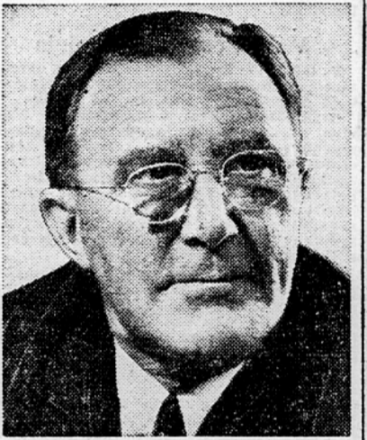
Charles E. Wilson, mož z izrednimi polnomočji, ki ima največjo oblast, kar je kdaj koli v zgodovini ZDA imel kak uradnik, je voditelj ameriške gospodarske mobilizacije za obrambo.