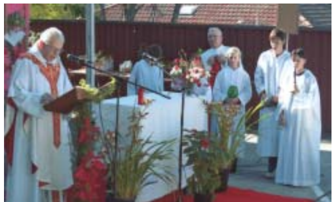
Za telovo je bil na dvoriš•u postavljen lepo okrašen oltar.