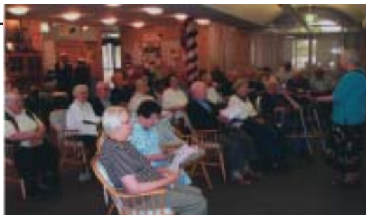
DOM POËITKA MATERE ROMANE Slovenski dom za ostarele 11-15 A'Beckett Street KEW VIC 3101