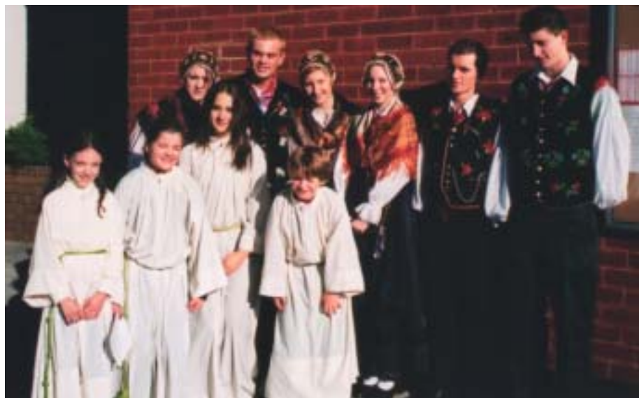
Ministrantje in mladi v narodnih nošah so kot lep šopek cvetlic v okras pri bogoslužju in ob različnih praznovanjih.

If you have any questions about anything I can help you with or an idea for a feature article... contact me on the email.