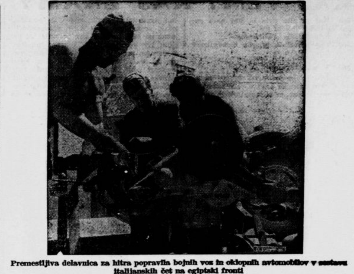
Premestljiva delavnica za hitra popravila bojnih voz in oklopnih avtomobilov v sestavi italijanskih čet na egiptski fronti

Henrik se je zmedeno smejal. »Komaj mi boš verjel, toda v zadnjih mesecih sem mo-ral odpustiti tri tajnice samo zato, ker se ji je zdelo, da so preljubke zame. Pa ven-dar so bila to dobra dekleta.« »Nisem mislil, da je Lea ljubosumna,« je menil Dušan in hitro dodal: »Ker je pa-metna.« Kajti zdelo se mu je, da je bilo prvo mnenje nekoliko neprimerno. No, Henrik ni pazil na take malenkosti. »Čudne stvari so se dogajale včasih tu,« je govori-l, »ne spodobi se skoraj, da bi pripovedo-val. Popivanja, histerični napadi in slično. Gotovo si v teku let spoznal mnogo žens-kih muhavosti nikdar pa nisi bil primoran živeti s takimi ženskami. In Lea je resnič-ni na ljubo povedano, od zlojča. Ima tudi čisto posebno navado, da me draži baš takrat,