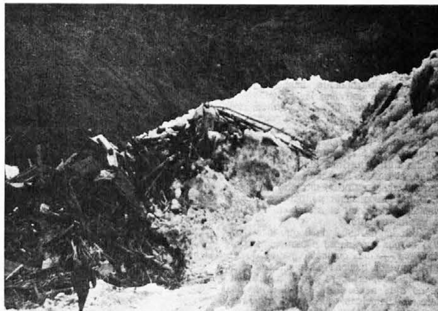
Tako izgleda sedaj gradbišče v Mattmarku, ki ga je zasul velikanski plaz, ki se je utrgal z ledenika Allalin in pokopal okoli sto delavcev. Slika nam prikazuje eno izmed barak, ki jo je prekril ledeni plaz in iz katere se ni rešil nihče

Če bi šlo za druge mlade, bi se radio in tisk ne samo razčrtorila, kot se pravi, ampak razosmerila, da bi spravili v zadrego demokrate in antifašiste, skratka vse tiste, katere neofašisti poniževalno označujejo za «soversive» (prevratnike).