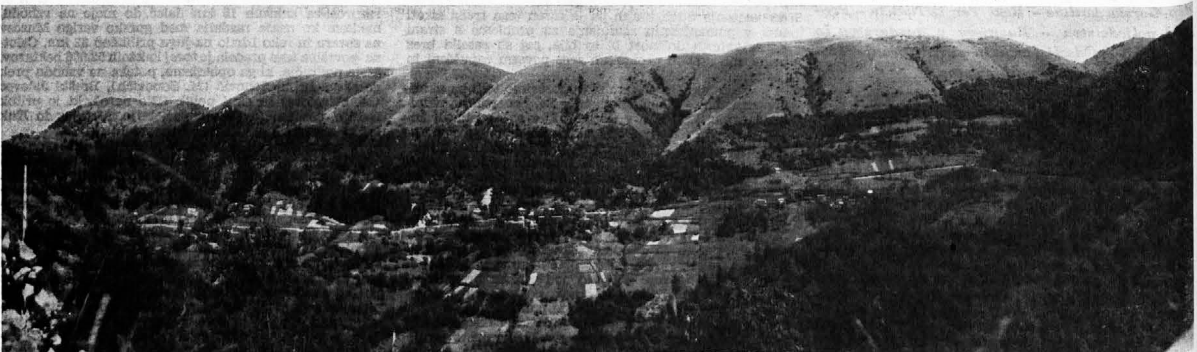
DREKA POD KOLOVRATOM: Panoramični razgledi na raztresene vasi, ki so prilepljene na južno pobočje Kolovrata nad 700 metrov visoko. Od tu se nam nudi krasen razgled po vsej furlanski nižini tja do morja. Cesta, ki poteka skoraj po grebenu, veže Livek z Goriškimi Brdi, ki so oddaljena kake pol ure vožnje. S Kolovratovega grebena se nam odpira razgled na Soško dolino, Kobarid, Tolmin in na vzhodne Juljske Alpe do Triglava. Nasproti Kolovrata se mogočno dviga Krn

ČEDAD - Divji prašiči so ljetos zlo kuražni, saj so se upali priti adnegà dne kar pred Čedad. Blo jih je sila dosti an so se pasli po njivah, kjer raste sjerak an krompir. Kar so se nasitili, so ubral pot pruoat Stari gori. Kmetje so zlo u skarbem, zakì djelajo veliko škodo po puoju an zatuò prosijo, de bi se organizirala jaga nanje še pred jesenjo.