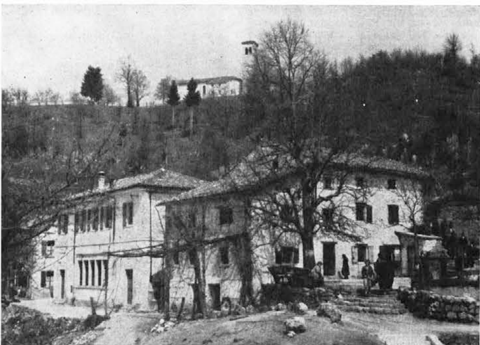
Vas Kras, ki je središče dreškega komun. Tu so komunski sedež, trgovine in gostilne in seveda tudi šola. Od tu se odpira prekrasen razgled na vso dolino

Infatti se si vogliono creare i presupposti per un reale sviluppo generale, economico e sociale, nei territori con popolazione di parlata slovena o con popolazione mistilingue — sviluppo atto ad assicurare, con ogni diritto civile, un'esistenza degna di essere vissuta e soprattutto tranquilla — non rimane altro che soddisfare appieno le giuste istanze che l'operosa e leale comunità etnica e linguistica delle nostre valli e convali dignitosamente invocano e a volte reclamano e che fanno parte della sua lunga e coraggiosa battaglia rivendicativa.