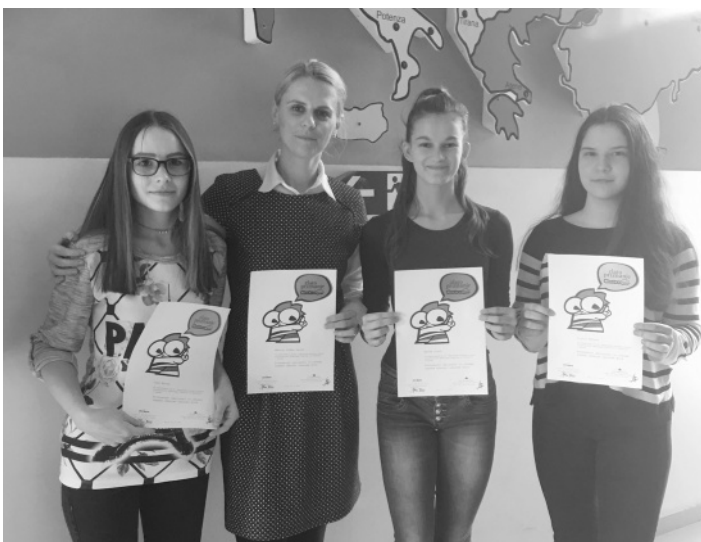
OŠ Destrnik - Trnovska vas

nalogo s področja športa z naslovom Povezanost agilnosti in učnega uspeha učencev osnovne šole. Tema nam na prvi pogled ni bila znana, vendar smo skozi raziskovanje spoznale, da se z agilnostjo srečujemo že od malih nog. Naš prvi cilj je bilo dobro poznavanje pojmov agilnosti, hitrosti in moči, zato smo s pomočjo različnih virov pripravile teoretični del. Prebrale smo veliko raziskav različnih strokovnjakov in si ustvarile tudi svoje lastno mnenje. Zastavile smo si tri hipoteze, ki smo jih potrdile s pomočjo opravljenih testov.