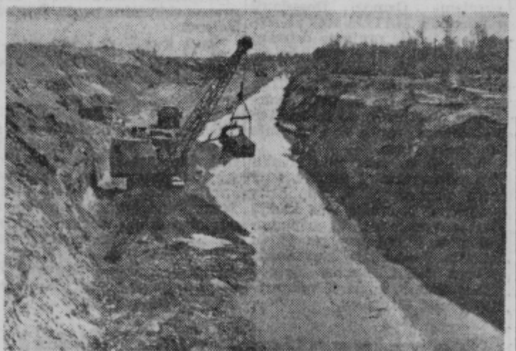
Pogled na del d elovišča

mesto, temveč trden in skoraj raven nasip, ob katerem bo drsela umirjena in zravnana Drava, pregnana iz svoje stare, vijugaste in različno globoke struge, po kateri je prinašala kragem na obeh obrežjih lepe in tudi tragične dni ter jim povzročala škodo. Na njo gledajo potniki iz letal na relaciji Zagreb—Dunaj kot na zvito belo vrh, ki