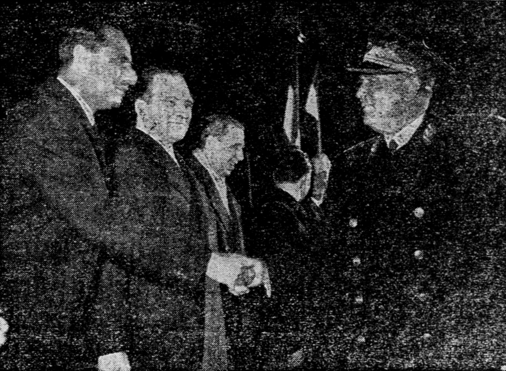
S sprejema predsednika Tita v Beogradu: predsednik Tito se na beograjski železniški postaji pozdravlja z indijskim veleposlanikom Rajeshvarom Dayalom.

Tajpeh, 13. febr. (AFP). Iz dobro obveščenih krogov na Formozi se je zvedelo, da so se kitajske enote izkrcale na evakuirancem otočju Tačenu.