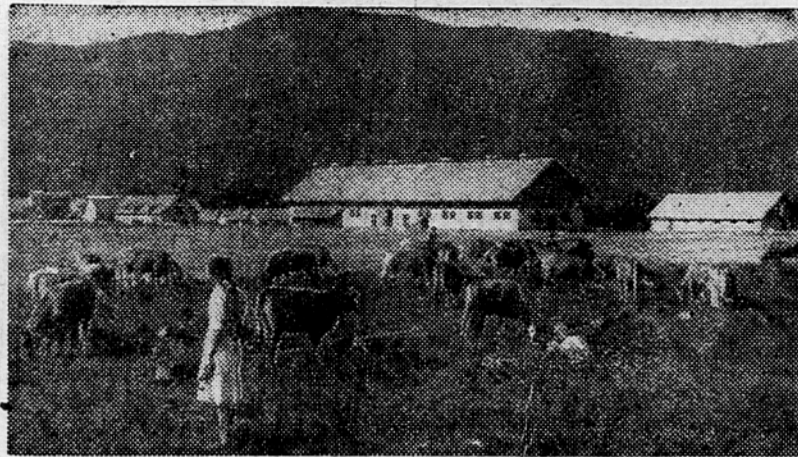
Državno posestvo na Mlaki

Na kočevskih državnih posestvih je bolj ko vse drugo doma živinoreja, zlasti v nižje ležečih predelih, dočim so v višjih legah ugodni pogoji za razvoj ovčevreje. Vendar so nam doslej vsa ta posestva dala razmeroma malo svojih proizvodov ali vsaj ne toliko, kolikor bi jih od njih lahko upravičeno pričakovali. Če bi iskali vzroke, bi jih lahko našli precej, od slabe organizacije posestev, pa do neurejenosti, če že ne zanemarjenosti, ki je vladala vse do zadnjega leta. V zadnjem času pa je prav Kočevska deležna več skrbi naših ljudskih oblasti kakor kdaj koli poprej. Prav zato so lahko na posestvih sprejeli lepe proizvodne načrte in bodo letos dala našim živilskim trgovcem večje količine potrebnih živil. Za prosti trg bodo letos kočevska državna posestva oddala 442 stotov klavne govede, 1127 stotov telet, 117 stotov pitanih in 880 stotov mesnatih prašičev, 82 stotov kokoši, več kakor 100 stotov ovc za zokol, nadalje 6300 hl mleka, 122.000 jajc in 54 stotov medu. Masla bodo prodala okrog 4200 kg, oddajajo pa tudi predvsem polnomastno mleko za preskrbo. Poleg vsega tega pa bodo prodala še večje količine poljskih pridelkov, tako krompirja, vrtnin, kumpustic ter svežega in suhega sadja, orehov in zganja.