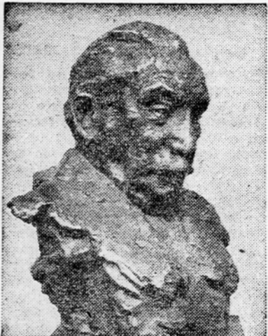
Antun Augustinčić: Portret Moše Pijade

Danes je Jugoslavija tista država, kateri napadalne sile najbolj grozijo. Običajno se v takšnem položaju skle-