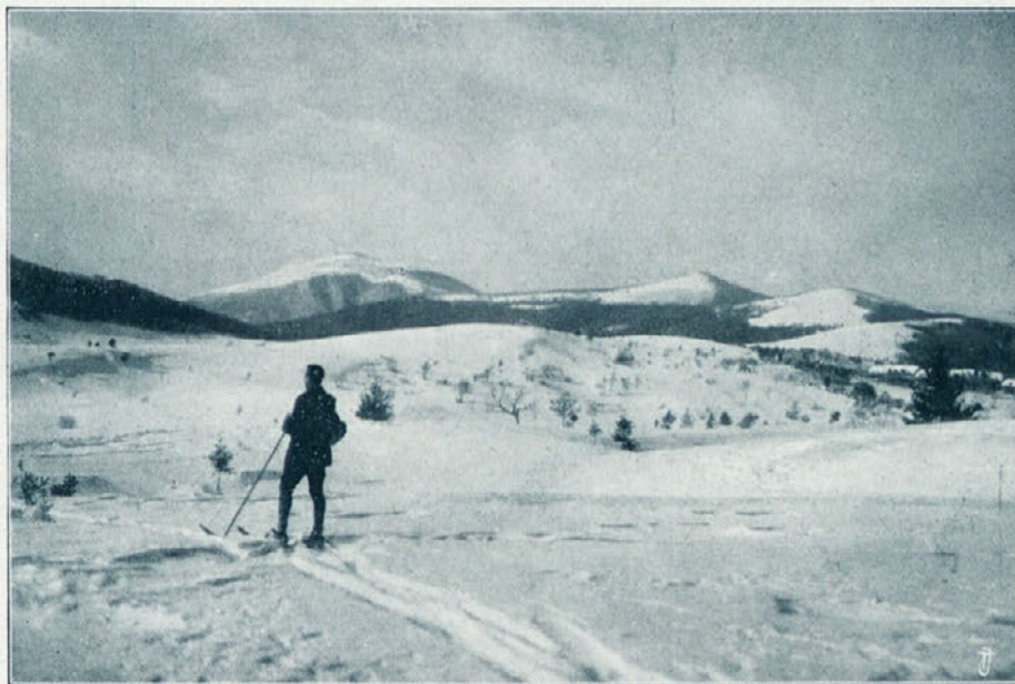
Smuški teren iz okolice Blok na Notranjskem.

Za pravoslavne božične praznike l. 1910. je bil naznanjen letalni poskus v Beogradu. Časopisje je o tem mnogo pisalo. Na božični dan je bilo živahno po mestu in vse je govorilo o slovenskem letalcu. Drugi dan — sv. Štefana dan — je vse čakalo na polet. Ob 11. uri je prišel na letališče Rusjan, živahno pozdravljen od množice. Bilo je precej vetrovno in znanci so Rusjanu prigovarjali, naj se pri takem vremenu ne spušča v zrak. Toda on se ni dal motiti. Prav dobre volje je sedel v aparat in se dvignil pred očmi začudene množice. Letel je nad beograjsko trdnjavo in se tam dvakrat zavil v loku. Naenkrat pa je vzkliknila vsa množica. Ljudje so zakrili oči, da niso videli groznega prizora. Letalcu se je odlomilo krilo — slišalo se je, kako je nekaj počilo — in aparat je padel z velike višine na beograjsko obzidje in ob zidovih navzdol v jarek. Vse je hitelo na kraj nesreče; vojak, ki je stal tam blizu in je bil prvi pri