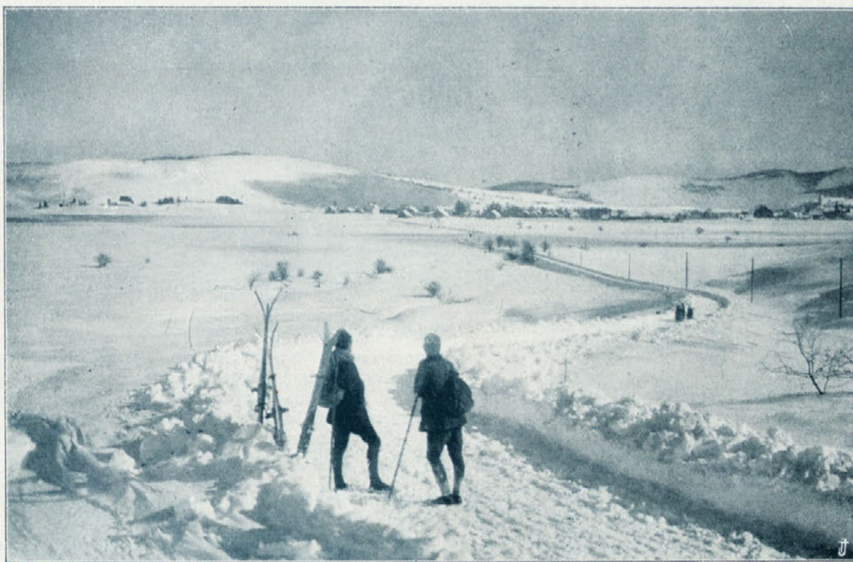
Smuški teren pri Podutiku nad Ljubljano.

Sportni teden 1921. Iz sportnega stališča je sportni teden 1921 uspel povoljno, udeležba tekmovalcev je bila