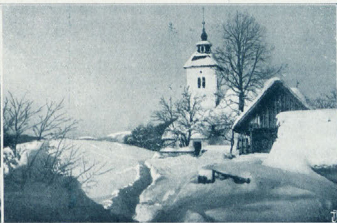
Sv. Florijan na potu od Sv. Jakoba v Medvode. — Pri Sv. Katarini.