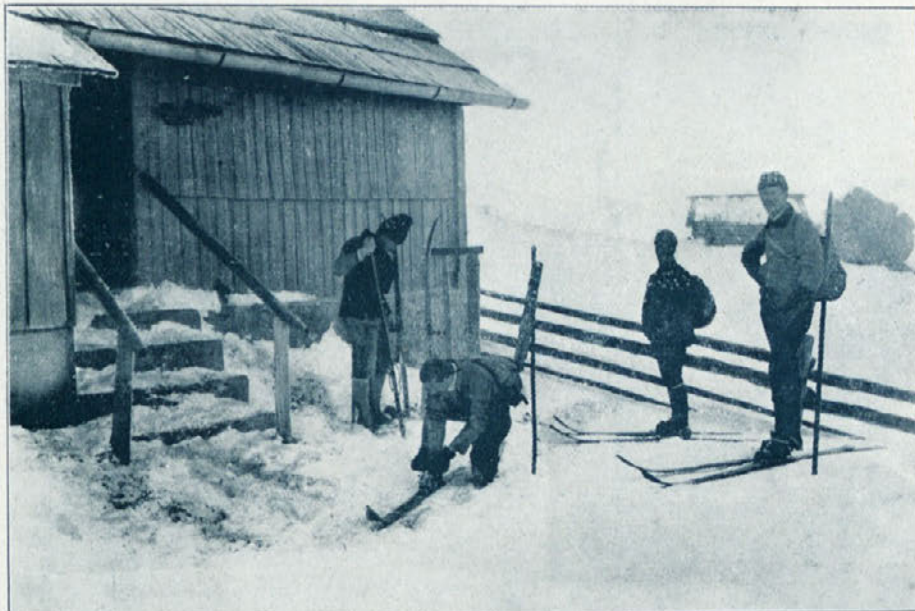
Odhod iz Schmidingerjeve kočice na Veliki Planini.