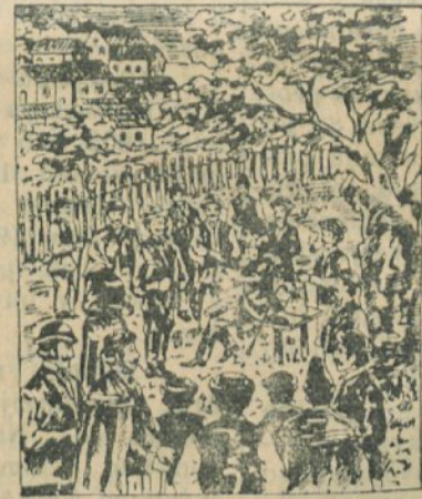
Vidmaric razkazuje setjanom nove Pa- kračke kapljice in Slavonske B iljevine.

Denar naj se pošilja tu- di naprej ali proti po- vzetju. Cena je sledeča in franko na vsako po- sto in si er: 12 stekle- nic (1 ducat K 5, 24 steklenic (2 ducata) K 8 60, 36 steklenic (3 du- cate) K 12 40, 48 ste-