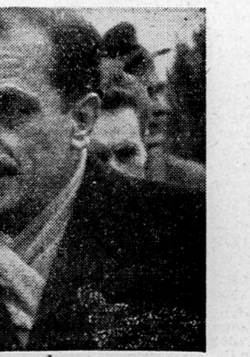
Državni sekretar Koča Popović po vrnitvi s Dunaja zopet govori na tisku v Münchnu