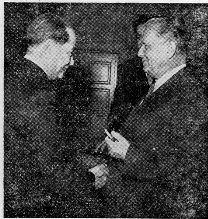
Predstavniki socialistične stranke Republike Španije pri predsedniku republike Ti tu