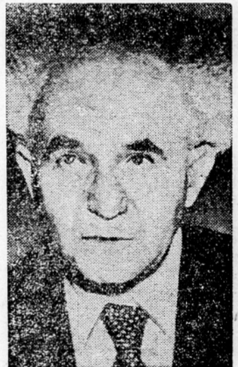
David Ben Gurion

Tel Aviv, 12. nov. (UP) Izraelska vladajoča stranka Mapai je ustanovila poseben odbor, ki bo proučil vprašanje sestave nove izraelske vlade, ker je predsednik vlade Ben Gurion