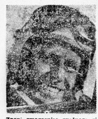
Znani zmagovalec zvočnega zidu, ameriški letalec Neville D. Ke, ki je že šestkrat letel z nadzvočno hitrostjo.

Povojna Nemčija je postala pravi raj za goljufe. Po podatkih UP (United Press) je v Zahodni Nemčiji v zaporu zaradi lažnih baronskih in grofovskih naslovov nad 2000 prebivalcev. Po podatkih same zahodnonemške policije pa je na svobodi še mnogo več takih, ki se šopirijo z lepo zvonečimi in podobnimi naslovi. Ime »barona« odpre vrata, na katere privzedevek »gospoda« lahko zama trka Te lahkoverne in neumne miselnosti se s pridom in v velikem obsegu poslužujejo razni goljufi pri svojih namerah. Policija in arhivi bivšega nemškega plemstva imajo polne roke dela. Toda preiskovanja jim ne grejo najbolje od rok. Nemške lahkovernosti se poslužujejo zlasti begunci iz Vzhodne Nemčije.