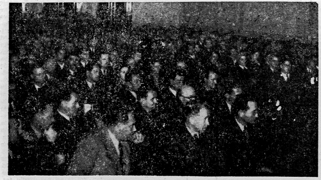
Včeraj popoldne je kandidat mesta Ljubljane za zvezno skupščino Edoard Kardelj o nabito polni dvorani Sindikalnega doma odgovarjal na številna vprašanja, ki so mu jih postavile terenske organizacije SZDL, sindikati, delavski sveti in posamezni delovni kolektivi. V svojem odgovoru se je dotaknil nek aktualnih političnih, gospodarskih in družbenih problemov ter pojasnil najrazličnejša vprašanja, ki zanimajo najširše kroge delovnih ljudi. Zlasti obširno se je zadržal na pojasnjevanju pomena in namena gospodarskih uredb, ki so že v javni diskusiji, kakor tudi tistih, ki so v pripravi ter o njihovem učinku na bodoči gospodarski razvoj. V tej zvezi se je dotaknil tudi problema obrtništva, bodoče vloge Narodne banke, odnosa podjetij do komunne, kmetijskega združništva ter vloge in razvoja socialistične trgovine. Obširno je govoril tudi o problemih socialnega zavarovanja in o zvezi s tem podčrtal bodočo vlogo ljudskih odborov in samih delovnih kolektivov za čim pravičnejše izvajanje razpoložljivih sredstev. Dotaknil se je tudi ukrepov za izraznoo cen ter pojasnjevanja stanovanjskih najemnin ter poudaril, da s tem nikakor ne bo prizadel življenjski standard delovnih ljudi. Njegovim oec kot triurnim izjavam, ki so jih sprejeli udeleženci konferenec z velikim odobravanjem, so prisostvovali med drugimi tudi predsednik Glavnega odbora SZDL Slovenije Miha Marinka.

Proizvodov. Tržne takse so v nekaterih mestih, posebno v Beogradu, precej visoke; le-te čisto znašajo tri do 4 odstotke vrednosti prometa, kar glede na razliko med odkupnimi in maloprodajnimi cenami predstavlja 4 do 6 odstotkov od odkupnih cen. Komisija ni predlagala, kako bi bilo treba organizirati inšpekcijo tržišč, smatrala pa je za potrebno, da se le-ta pojača. Prav tako je izrazila mnenje, da bi bilo treba bolj skrbeti za zalogo blaga pri velikih podjetjih, ki jih le-ta hranijo za tiste dni, ko se bodo cene blaga na tržiščih zvišale. Po vsej verjetnosti bi ukrepi, ki jih je predlagala komisija deloma izboljšali položaj na tržišču s kmetijskimi pridelki. Vendar je ta problem možno popolnoma rešiti šele tedaj, ko bodo mesta zagotovila potrebna tehnična sredstva za transport in vskladiščenje blaga (kemično, hladilnice, skladišča, delavnice za predelavo hitro pokvarljivega blaga itd.).