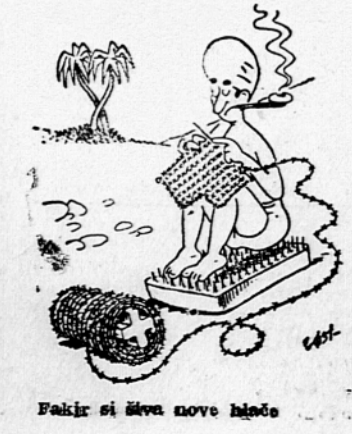
Fakir si šiva nove hlače

Na zahtevo norveške vlade bo mislila mednarodne banke za obnovo in razvoj obiskala Norveško. Preučila bo splošno ekonomsko stanje in se seznanila z norveškimi investicijskimi načrti, za izvedbo katerih bo Norveška morda zaprosila za posojilo. Mislja bo ostala v Norveški štiri tedne.