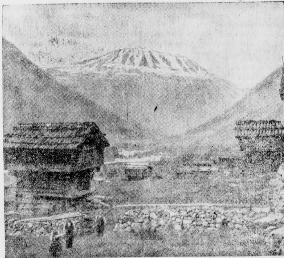
Eine eigenartige und schöne Landschaft besitzt Süd-Norwegen, wo jetzt in Rjukan das größte Kraftwerk Nord-Europas erstanden ist. Noch bis in die heutige Zeit hat sich diese Gegend ihren naturhaften Charakter bewahrt.