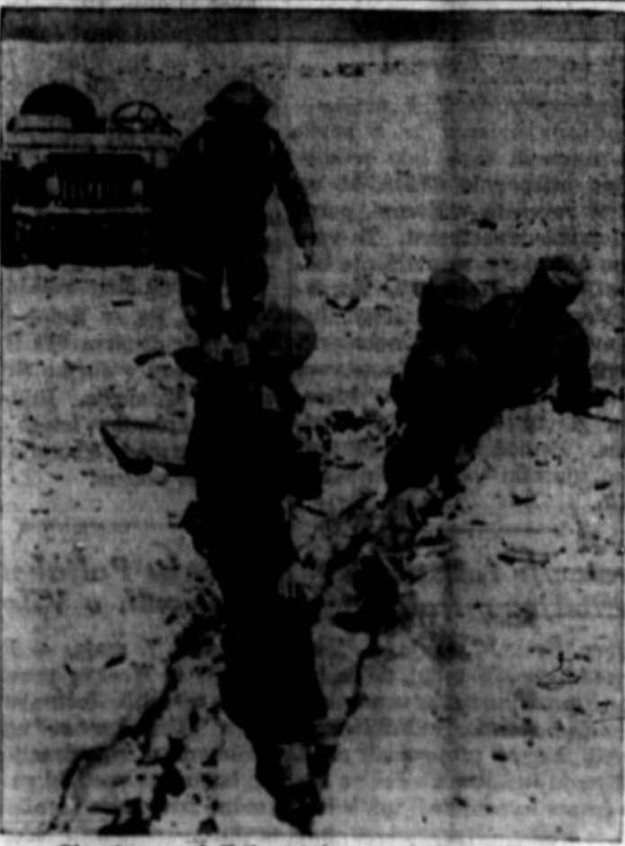
Skupina angleških vojakov v afriški puščavi.

Tudi to pot je dobro opisala svoj dolgčas in da ni več lušno, ker nihče ne poroča o njihovem slavnem Oglešbyju in tako naprej.