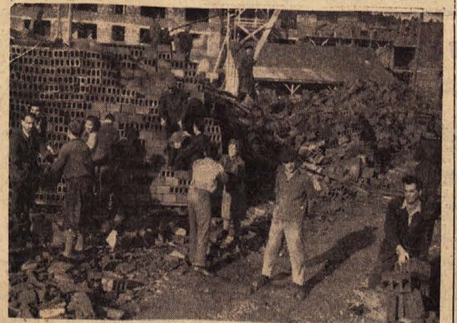
Čim jim dopušča čas, priskočijo tudi študentje na pomoč

»To bodo gledali študentje, ko bodo prihodnji teden prišli na sedemdnevno