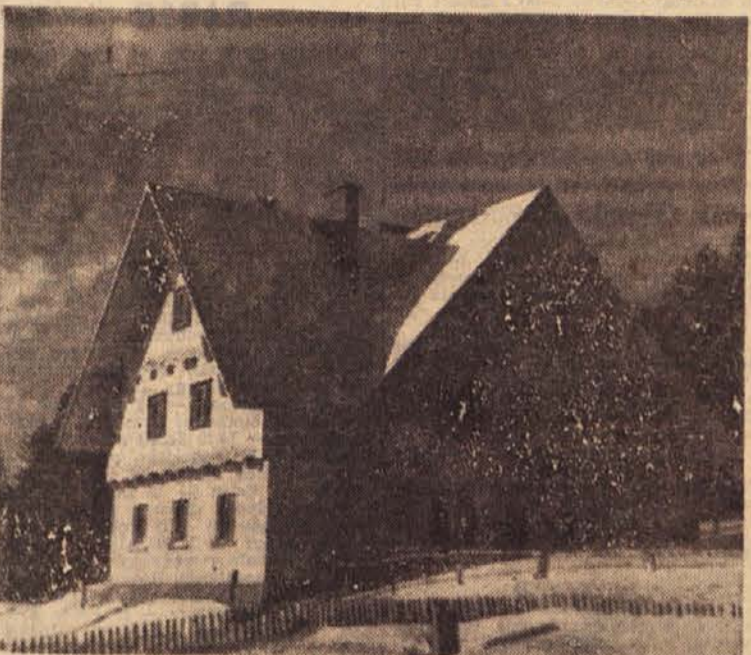
Izgradnja naših planinskih domov na Pohorju, kjer je prejšnje okupator upeljal do tal, bo omogočila našim delovnim ljudem oddih in razvedrilo poleti in pozimi. Na sliki: »Tinotov dom« v snegu, ki je zapadel pretekli teden.

Maribor, 18. novembra. Visoko na Pohorju, med gostim smrekovim gozdom, od koder je pogled na razsežno Dravsko polje, je zgrajen »Kagerjev dom«. Zgradilo so ga pridne roke delavcev in nameščenec kolektiva iz litografskega materiala na zgradbi 40.000 ur. Znanstveno delo na kolektivni preji delavcev glavnega odbora sindikatov Slovenije. Tako so kovinarji dobili nov poletniški dom, v katerem bodo v svojem prostem času našli svoj drugi dom. Kolektiv »Metalne« je ponosen na svoj uspeh in želi, da bi se sodelovali v kovinarstvu, ki bodo obiskovali »Kagerjev dom«, da bi se v domu dobro počutili. H. J.