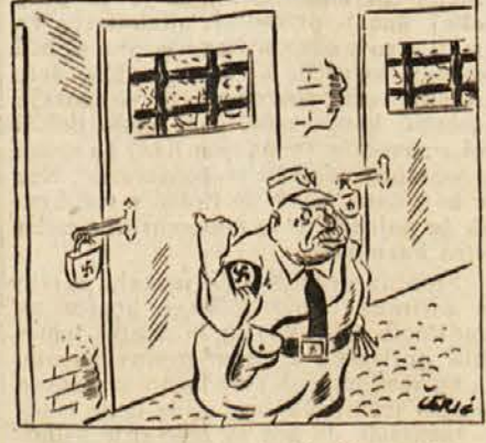
Evo vam vaš teritorij, Slovenci, garancije zanj pa nudijo Angličani in Amerikanci...

Angloamerikanci odbijajo jugoslovanske teritorialne zahteve, ker je »Slovenska manjšina v Avstriji« že dobila garancije. (Radio London)