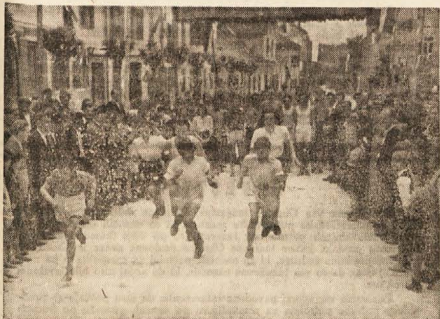
Titova štafeta v Mozirju leta 1947

Tudi letos bodo fizikulturniki in udarniki srednješolska in vaška mladina iz vseh krajev Slovenije in države s Titovo štafeto ponesli pozdravo vsega našega ljudstva dragemu maršalu Titu in mu čestitali k njegovemu rojstnemu dnevu. Obenem bo Titova štafeta poročilo delovnega ljudstva iz kraje slavne iz narodno-osvobodilne borbe, po petih stozah, kjer so se premikale partizanske brigade, pa tudi po možnostih čez tiste vase, kjer grade zadružne domove. Letos bo Titova štafeta organizacijsko močnejša in številčno večja, kakor lansko leto. Zato so formirali pri glavnih, okrajnih in mestnih fizikulturnih odborih posebne štabe Titove štafete, ki bodo skrbeli za celotno organizacijo, t. j. pripravili načrt prog, število tekačev, izdelavo štafetnih palic, a njihova najvažja skrb mora biti v čim bolj množični udeležbi naše mladine. Te naloge bodo morali odbori v tesnem sodelovanju s množičnimi organizacijami in JA vestno in točno izpolniti. Ob prihodu vseh štafet v Ljubljano bo posebna komisija pregledala te palice in nato izbrala za štafeto palico LR Slovenije, ki je bo naš tekač predal maršalu Titu. Prihod vseh štafet v Beograd bo 25. maja ob 17. uri na Trg republike.