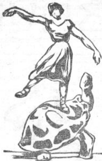
Naša slika predstavlja ameriško plesalko Grady, ki pleše na 300letni želvi v Newyorku.