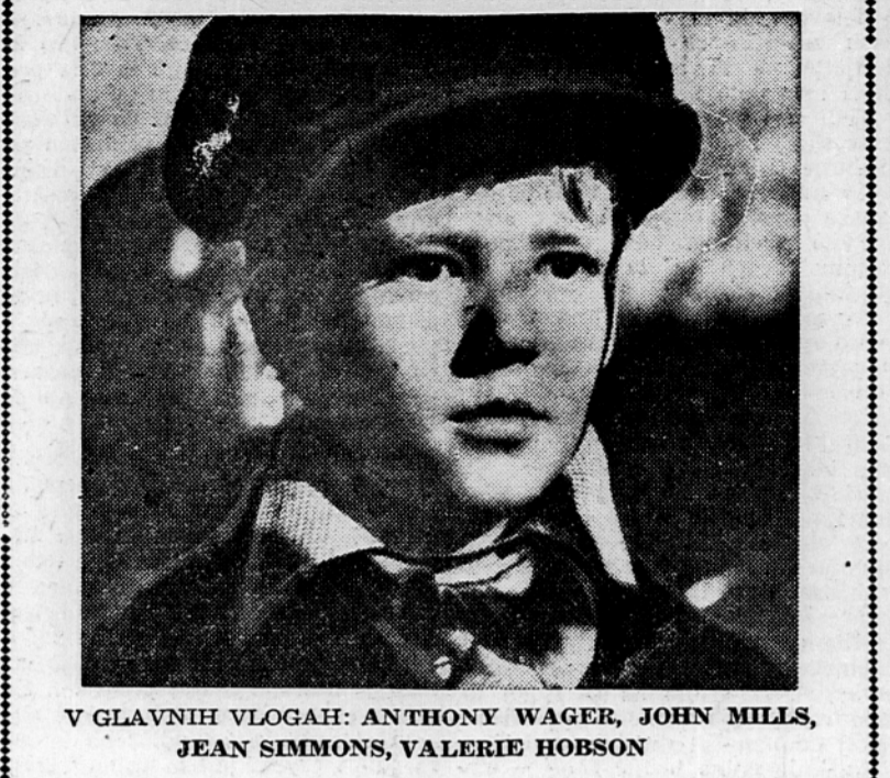
V GLAVNIH VLOGAH: ANTHONY WAGER, JOHN MILLS, JEAN SIMMONS, VALERIE HOBSON

PREDVABA PREMIERO ANGLEŠKEGA UMETNIŠKEGA FILMA »VELIKO PRIČAKOVANJE« PO ROMANU CHARLESA DICKENSA