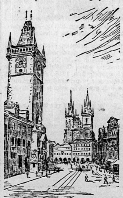
Starý magistrát v Prahi, ki so ga nemški nacisti v maju 1945 poškodovali

v Revuci in v Vranovu na vzhodnem Slovaškem. V prvem mestu bo zgrajena ve-