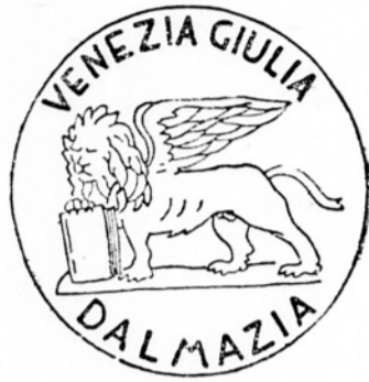
Volilni znak begunske liste »Leva sv. Marka«, v katerem so izražene imperialistične želje italijanske irendence.

Posebnost goriških volitev pa je lista beguncev. Ze samo dejstvo, da so si begunci za volitve postavili samostojno listo, kaže, kako ogromno število teh ljudi so italijanske oblasti naselile v Gorici. Po eni strani skušajo te ljudi držati v bližini jugoslovanske meje, ker so jim potrebni za razne izzivalne akcije, za širjenje irendentistične propagande in ustvarjanja čim bolj protijugoslovanskega vzdušja, po drugi strani pa so z naseljevanjem beguncev spremenili narodnostni sestav slovenskih goriških predmestij, zlasti Standerža, kjer so postavili prvo begunsko kolonijo (z lastno šolo, še celo cesto so jim asfaltirali, toda le do naselja, tik za naseljem, kjer se pričenejo hiše Slovencev, pa je konec asfalta). Uradni naziv liste begun-