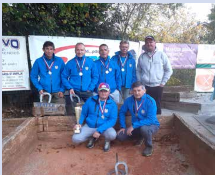
Ekipa podkvarjev 2. mesto v sezoni 2020/21

Kako čas beži. Ko sem v prejšnji izdaji »našega Mengšana« pisal o novicah z balin placa, smo bili malo čez polovico igralne sezone, no, sedaj smo skoraj že na koncu. Zaključili smo vsa letošnja tekmovanja, tako naša ekipa, ki tekmuje v prvi državni ligi, kot tudi vse tri ekipe veteranov, ki so razvrščene: 1. ekipa v skupino A in dve ekipi, ki tekmujeta v skupini B, od katerih je ena ekipa, v kateri tekmuje devet naših deklet, vodja ekipe je moški, druga pa je ekipa naših članov, ki tekmujejo v metanju podkev. Metalci podkev so letošnje prvenstvo končali z odlično uvrstitvijo na lestvici (drugo mesto). Metanje podkev je lepa igra, ki močno pridobiva na popularnosti in gledanosti. Res je zelo atraktivna in zanimiva.