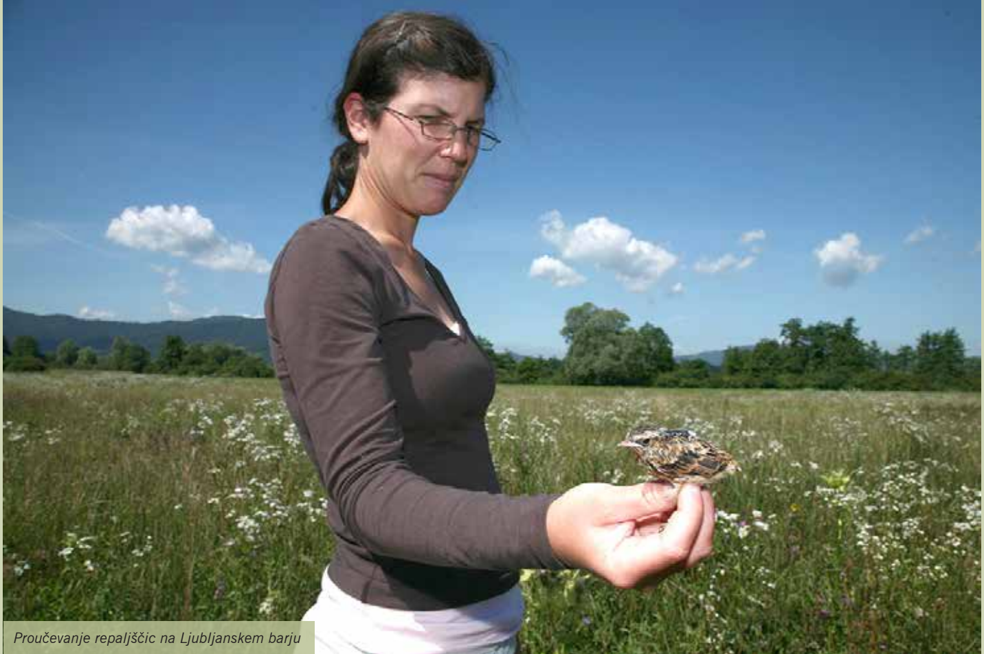
Proučevanje repaljščic na Ljubljanskem barju