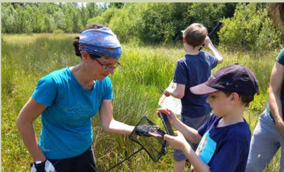
Med izletom v okviru akcije »Za naravo ob Savo« ob protestu proti gradnji novih hidroelektrarn na Savi.