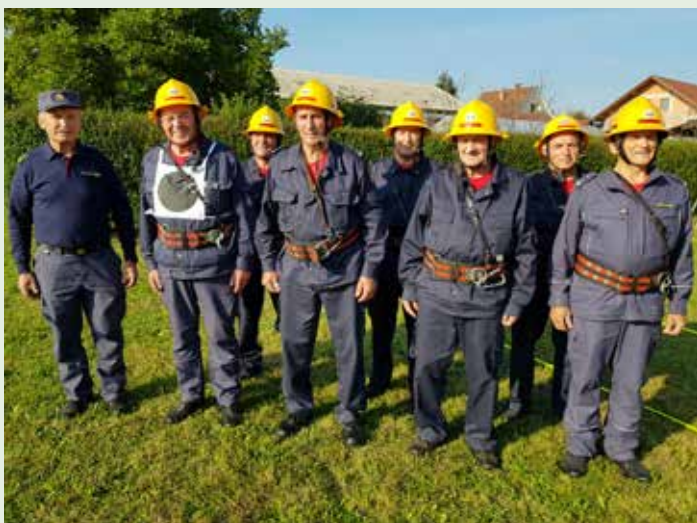
Ekipa veteranov na tekmovanju v Študi

V Topolah je dejavnosti ob mesecu oktobru začela tekmovalna ekipa veteranov, ki se je v soboto, 2. oktobra, udeležila meddruštvenega tekmovanja v Študi. Tekmovali so v dveh tekmovalnih disciplinah, in sicer v vaji s hidrantom in vaji raznoterosti ter v izredno močni konkurenci osvojili zelo dobro šesto mesto, kar je dobra popotnica za izbirna tekmovanja v letu 2022, ki bodo štela za nastop na državnem tekmovanju.