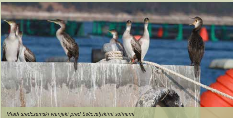
Mladi sredozemski vranjeki pred Sečoveljskimi solinami