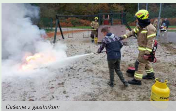
Gašenje z gasilnikom

Gasilski oktober se je zaključil v soboto, 30. oktobra, v gasilskem domu, kjer so mladi ob pomoči mentorjev in staršev izrezovali strahove iz buč.