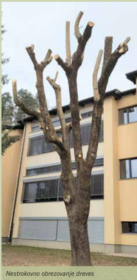
Nestrokovno obrezovanje dreves

ča se raznolikim temam s področja varstva ptic in njihovega življenjskega okolja. Seveda je vse to v povezavi s širšo problematiko, njen skupni imenovalac pa so napačni posegi človeka v naravo. Razlogi za to so