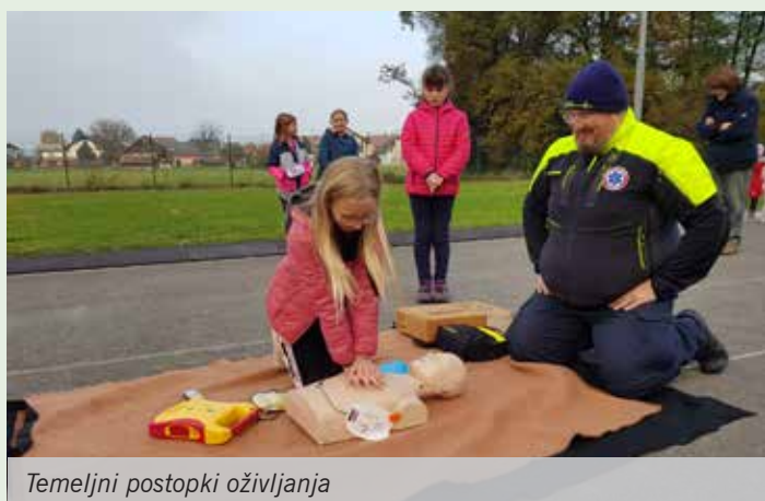
Temeljni postopki oživljanja