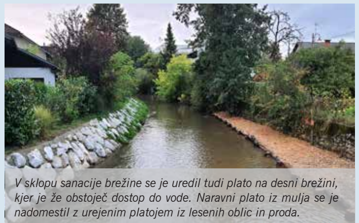
V sklopu sanacije brežine se je uredil tudi plato na desni brežini, kjer je že obstoječ dostop do vode. Naravni plato iz mulja se je nadomestil z urejenim platojem iz lesenih oblic in proda.