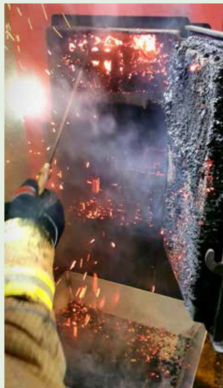
Ob požaru – dimu v hiši na Glavičevi ulici

Uprava za zaščito in reševanje Slovenije in GZ Slovenije vsako leto dasta poudarek zgoraj navedenemu motu z izbrano vsebino. Letošnja je bila: »Po potresu lahko tudi zagori!« Tudi v takih razmerah moramo razsodno ravnati z ognjem, da se naravna nesreča ne sprevrže v še hujšo obliko.