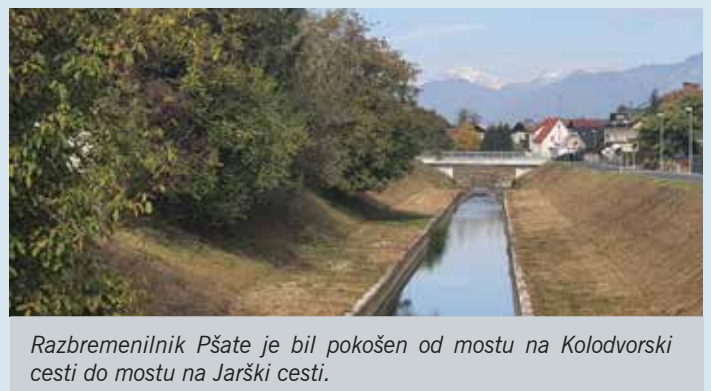
Razbremenilnik Pšate je bil pokošen od mostu na Kolodvorski cesti do mostu na Jarški cesti.

V sklopu sanacije brežine se je uredil tudi plato na desni brežini, kjer je že obstoječ dostop do vode. Naravni plato iz mulja se je nadomestil