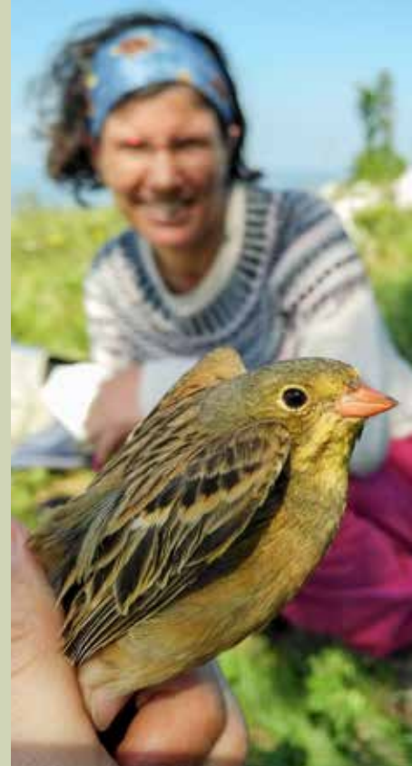
Med obročkanjem vrtnih strnadov na Učki