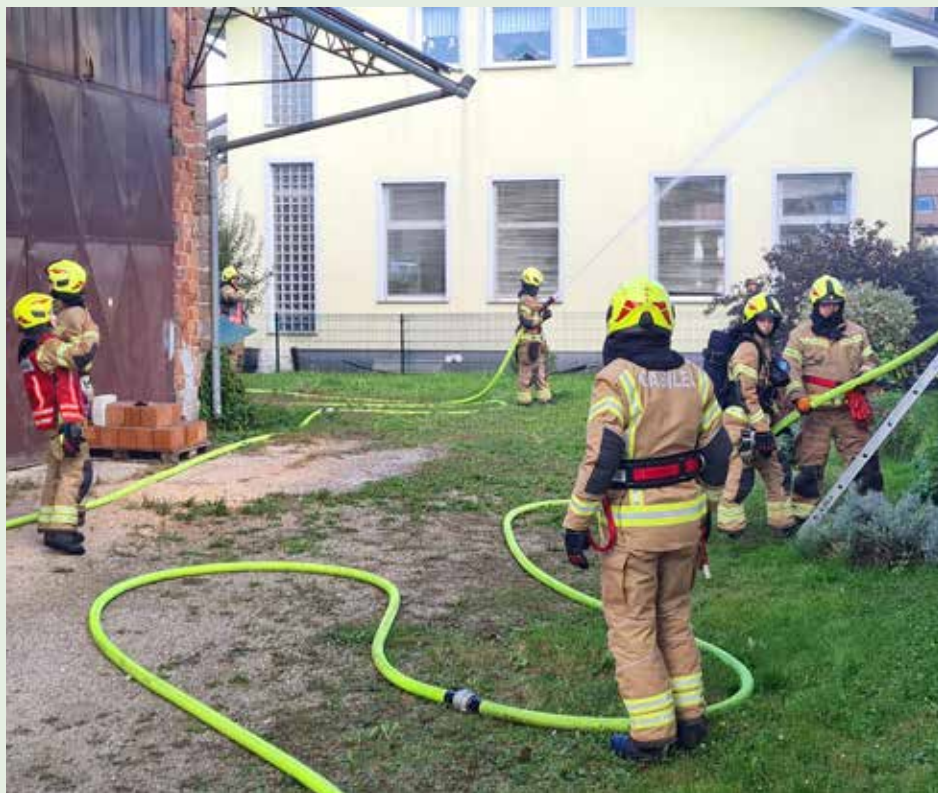
Na gasilsko reševalni vaji v Topolah

Oktober je že vrsto let obeležen kot »mesec varstva pred požarom«. S tem motom poskušamo vsaj malo opomniti vse nas, da je veliko možnosti, ko majhen ogenj lahko hitro preraste v (velik) požar. Zato je na nas, da skrajno previdno in razumno ravnamo z vsem, kar je vnetljivega okoli nas oziroma pri našem vsakodnevnem delu. Jesen in zima sta obdobji leta, ko nam prav ogenj prinaša toploto, ki nam je še kako potrebna. Da toploto dobimo brez zapletov, pa je naloga vseh nas in vzdrževalcev, da so kurilne naprave brezhibno pripravljene za varno obratovanje preko zime.