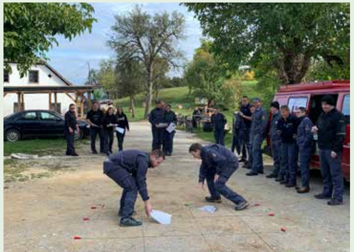
Mentorji pri izvedbi nalog