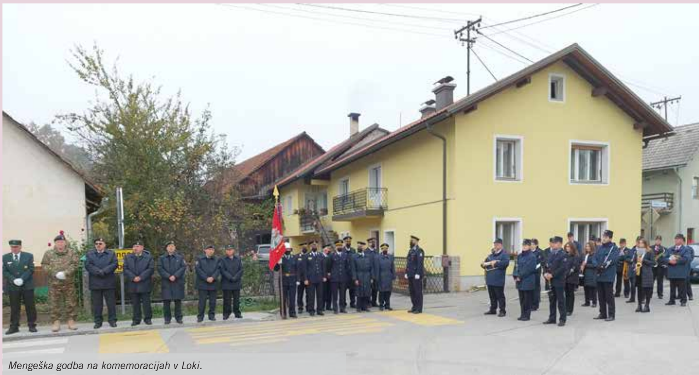
Mengeška godba na komemoracijah v Loki.