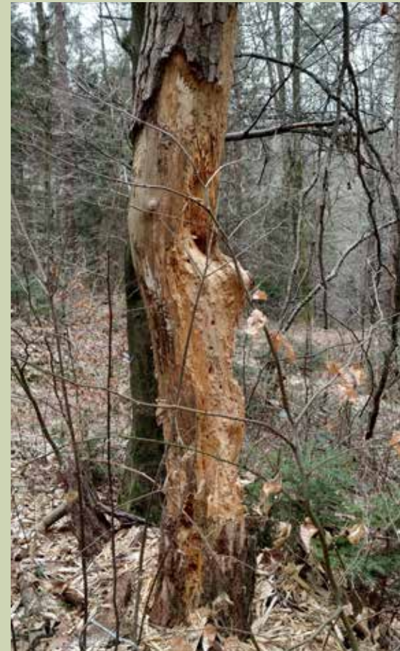
Odmirajoča drevesa v gozdu imajo izjemno pomembno vlogo pri ohranjanju biodiverzitete