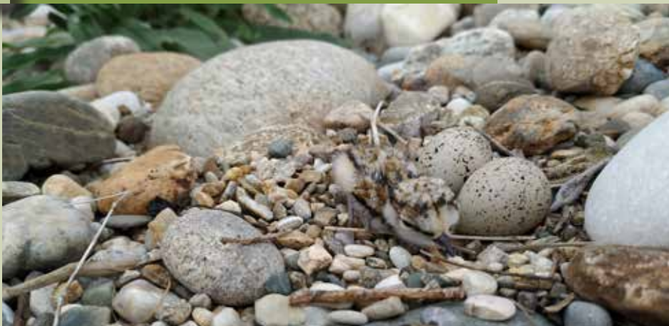
Pravkar izvaljen mladič malega deževnika v gnezdu na golemu progu

»Pšato lahko na nekaterih delih revitaliziramo, ne moremo pa ji v celoti povrniti naravne podobe. Tudi stara struga čaka, da ji posvetimo pozornost. Treba je odstraniti, kar je odvečnega, jo revitalizirati, skoznjo znova vzpostaviti vodni tok. Obrežna vegetacija mora postati bogat habitat za različne živalske vrste. Ohraniti je treba kar največji del naravnih struktur, zlasti pa stara drevesa, ki imajo še posebno veliko habitatno vrednost. Odstranjevanje obrežne vegetacije ob vodotokih je sploh eden izmed največjih grehov nad naravo s številnimi slabimi posledicami, kot so razrast invazivnih rastlin, izguba naravne utrditve brežin, pregrevanje vode ...« Sam sem otrok narave, vse življenje povezan z njo. Zemljo z vsemi drobnimi bitjci v njej in tistimi, ki hodijo ali letajo nad njo, skoraj častim. Iz otroštva se spomnim neskončne hvaležnosti staršev zemlji, ki nas je preživele ter nas včasih bolj včasih manj radodarno nagradila za ves naš trud in kaplje znoja. Še se spomnim, kako se je mati zahvaljevala 'ubogi naši njivici' za njeno dobroto. Danes so podobe neskončne pestrosti narave mnogokje v Sloveniji v marsičem le lep spomin. Skrbno obdelane površine na ravninah in po bregovih, različnih barv in oblik, vsaka svet zase in vendarle druga drugi podobne. V zraku in po grmovju jate razposajenih ptic, v travi polno malih živalic, ki so begale sem