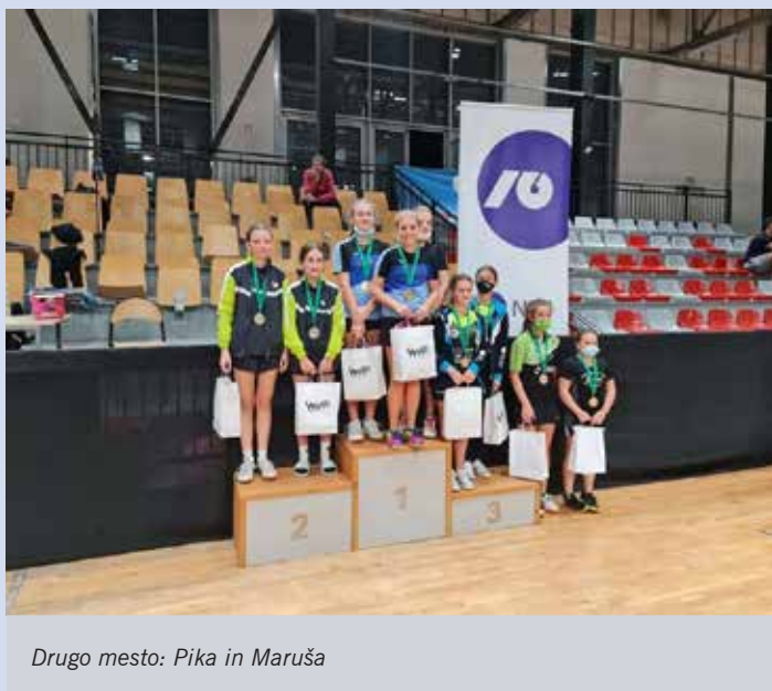
Drugo mesto: Pika in Maruša

Leta 2020 smo v Sloveniji prvič uradno praznovali 23. Uspešen nastop mengeških tekmovalcev in tekmovalk. Tradicionalno tekmovanje je organiziralo Namiznoteniško društvo Kajuh Slovan.