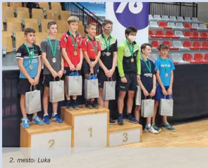
2. mesto: Luka