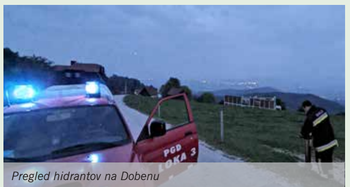
Pregled hidrantov na Dobenu