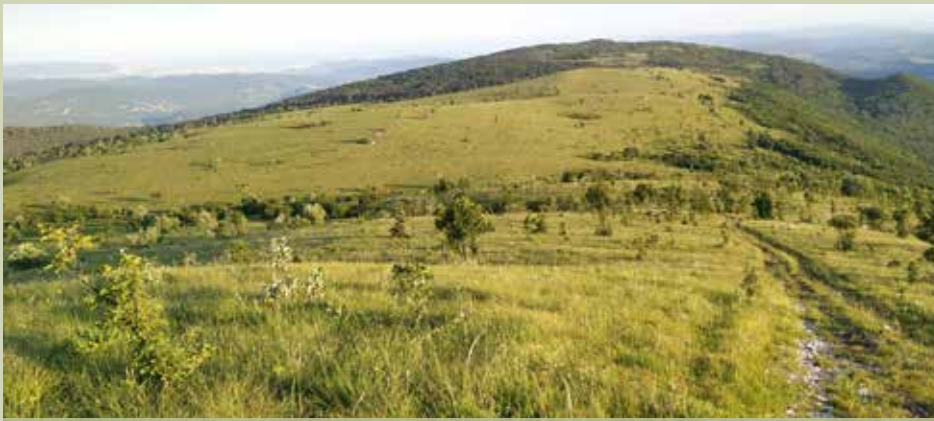
Opuščanje tradicionalne rabe prostora na krasu vodi v zaraščanje izjemno pestrih kraških travnišč

je naše upanje. Upanje ni blablaba. Upanje vedno prihaja iz ljudi.« Prekipelo je tudi Antoniu Guteresu, generalnemu sekretarju OZN. »Čas je, da rečemo: dovolj. Dovolj je nasilja nad biotsko raznolikostjo. Dovolj je ubijanja samih sebe z ogljikom. Dovolj je ravnanja z naravo kot s straniščem. Dovolj je sežiganja in vrtanja in rudarjenja še globlje. Kopljemo si lasten grob ... Armada za podnebno akcijo, ki jo vodijo mladi ljudje, je neustavljiva. Povečuje se. Glasnejša postaja. Zagotavljam vam, da se ne bo umaknila. In jaz sem z njimi.«