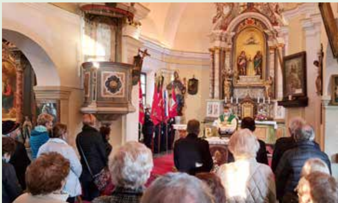
Sv. maša za pokojne in žive gasilce v cerkvi sv. Primoža in Felicijana