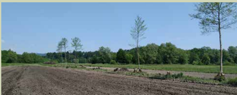
Sečnja mejic in preoravanje travnikov v njive so glavni dejavniki upada populacij ptic in nasploh biodiverzitet v kulturni krajini