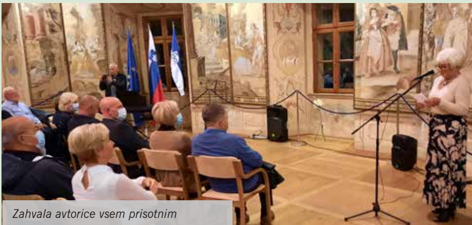
Zahvala avtorice vsem prisotnim

Dolgi sončni, poletni dnevi so se skrčili in spremenili v deževne in vetrovne jesenske dni z dolgimi večeri. Nekateri jih preživljamo pred TV, nekateri ob branju zanimive knjige, ki nam jo je priporočil znanec, drugi pa ...? Kakorkoli že, daljši jesenski dnevi so najlepši v dobri družbi s prijatelji in znanci, ob dobri glasbi, poeziji in če je še ambient primeren dogodku, je to lahko res nekaj lepega.