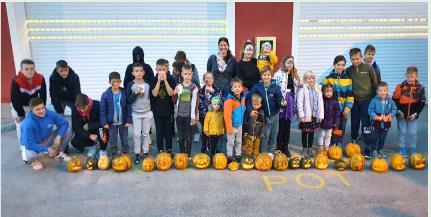
Izdelki mladih loških gasilcev za noč čarovnic

odprtih vrat. Šlo je za prikaz izvedbe vrвне žičnice. Mladi iz PGD Topole so bili navdušeni in se veselo spustili po njej;.