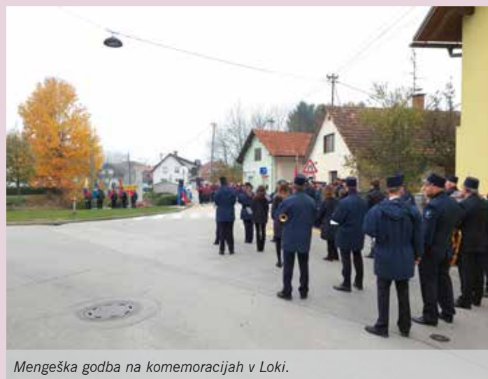
Mengeška godba na komemoracijah v Loki.