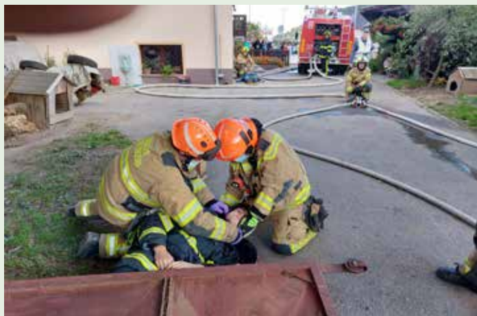
Reševanje izpod bremena