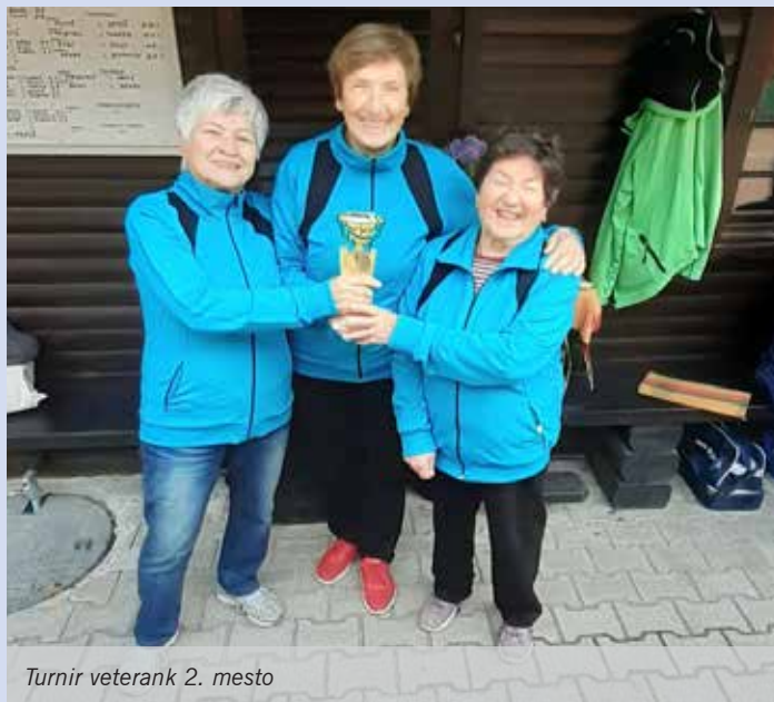
Turnir veterank 2. mesto

Med tem časom so se tudi naša dekleta udeležila turnirja v Trzinu in v naše vitrine prinesle pokal za drugo mesto.