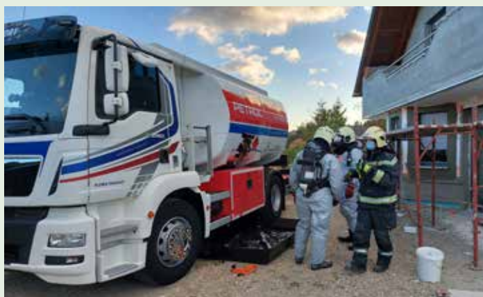
Nesreča z nevarno snovjo

Posamezne nastope so pozorno spremljali ocenjevalci vaje, ki so ob zaključku podali strokovno oceno, ki je temeljila na oceni pristopa k posameznim nalogam. Splošna ocena je bila pohvalna, saj so posamezni pristopi in izvedbe nalog potekali v skladu z operativnimi