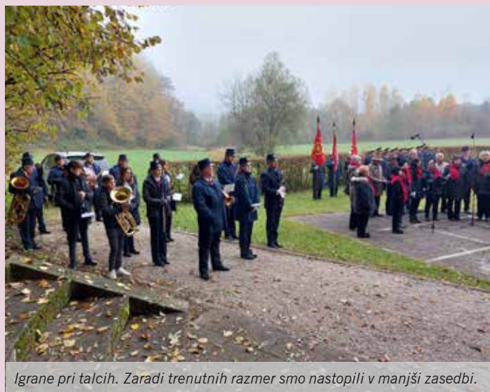
Igrane pri talcih. Zaradi trenutnih razmer smo nastopili v manjši zasedbi.