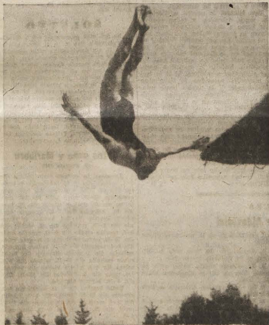
S tekem za plavalno prvenstvo Slovenije v Mariboru

Gusar je vložil protest, ker mu je v tekmi osmercev Mladost dreskala progo in bo verjetno ta točka razveljavljena. V primeru, da se tekma v osmercu ponovi, bo prvak države in obenem LR Hrvatske tisti, ki bo zmagal v ponovni tekmi.