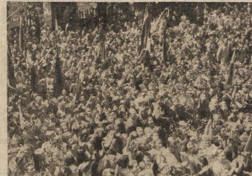
Nepregledna množica na Jesenicah poslušajo govor maršala Tita

po tem niso prenehale. Vi veste, da je tudi po tem skoro vsak dan, pa naj je bilo lepo ali oblačno, a oblakov, kakor veste, je v letošnjem letu bilo nad Jugoslavijo na žalost zelo malo, prišlo do nadaljnjih kršitev naših meja in našega ozemlja. Vi veste, da so skoro vsak dan naše ozemlje preletavala ne samo civilna, marveč tudi vojaška letala, ne samo posamezno, marveč cele es drile. (Tako je! Tako je!) Spominjate se in veste, da sem kot namestnik ministra za zunanje zadeve v zadnjih dneh poslal noto, v kateri so poudarjeni ponovni primeri kršitev naših meja. Ali mislite, da so po vsem tem storili kaj, da se to prepreči? Ne. Ničesar niso storili. Rekli so nam, da jim moramo dati številko letal. Ali lahko vidite v višini dva ali tri tisoč metrov številko letala? Ne vidite, to je razumljivo. Toda, če se primeri kaj takega, kot se je z onim letalom, ki je bilo prisiljeno pristati, potem se najde na stotine izgovorov in se trdi, da je možno, da se je izgubilo v oblakih, čeprav je bilo nebo popolnoma jasno. Potem gredo še dalje, pa sramotijo in klevetajo našo vojsko. Izmišljajo si, da letalu ni bil dan