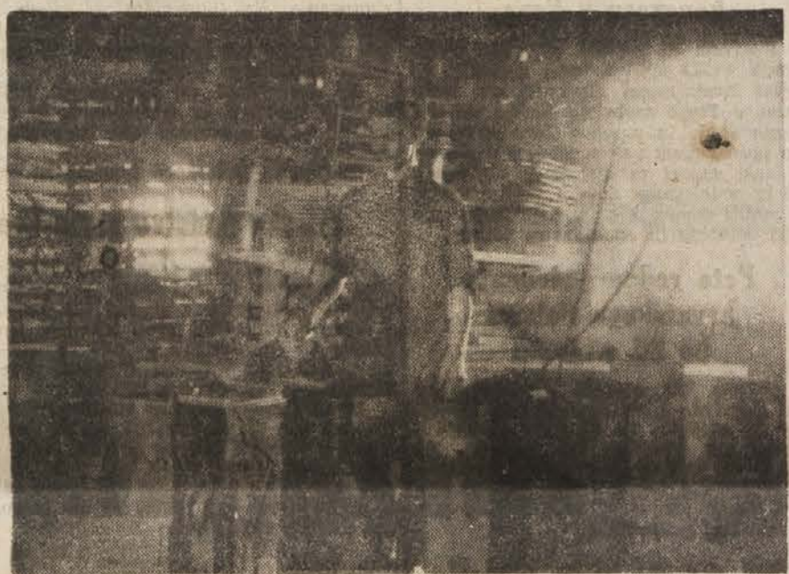
Peč v Celjski opekarni kurijo z napravo, ki vsako minuto spusti v ogenj prgišče premoaga

Primer mariborske opekarnice pri uvajanju norm bi moral biti za vzor celjskim. Zaradi nesodelovanja in nepravilnega odnosa delegata celjske opekarnice do nekaterih važnih problemov, je med delavstvom precej negotovanja Res je, da so opekarnice dosegle po osvoboditvi zaradi požrtvovalnosti delavcev precejšnje uspehe, toda ti uspehi bodo še večji in produkcija se bo dvignila še bolj, če se bodo izboljšali odnosi med upravo in delavstvom in če bodo čim prej uvedli delovne norme.