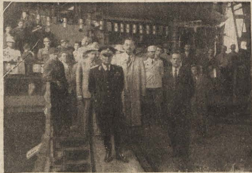
Maršal Tito in člani vlade LRS opazujejo prediranje jeseniškega plavža

Mi nočemo miru za vsako ceno, ker smo ga preveč drago plačali. Mi ne plačamo več niti pare za ta mir, mi nočemo dati niti pedi naše zemlje, ki nam po pravici pripada, mi svojega ne damo, toda želimo mir, želimo najboljše odnose z vsemi državami. Tito.