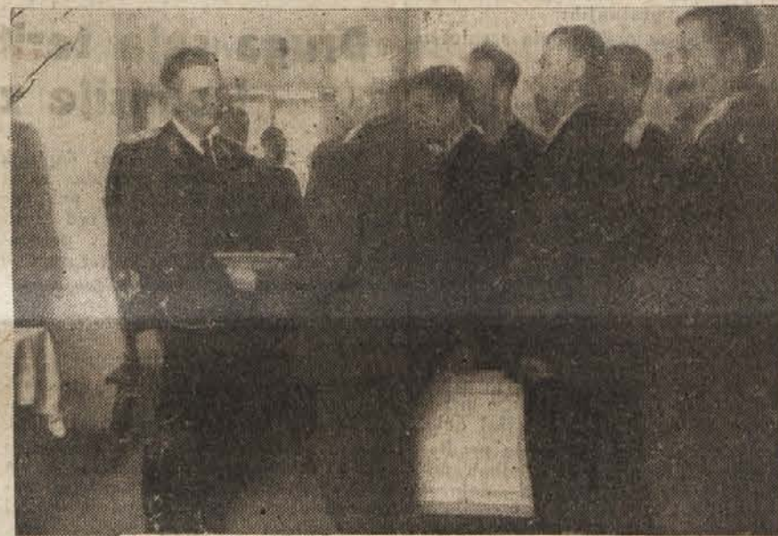
Kmetje iz vasi Rateče-Planica so prinesli maršalu Titu dokaze o krivični razmejitvi njihove vasi