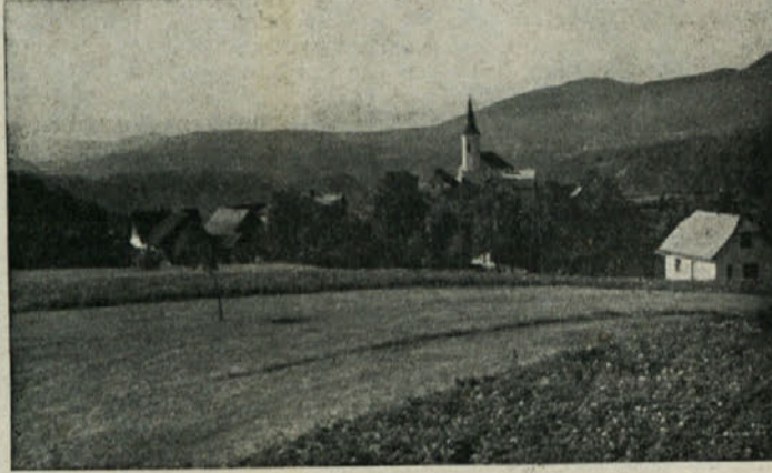
Stari trg ob Kolpi