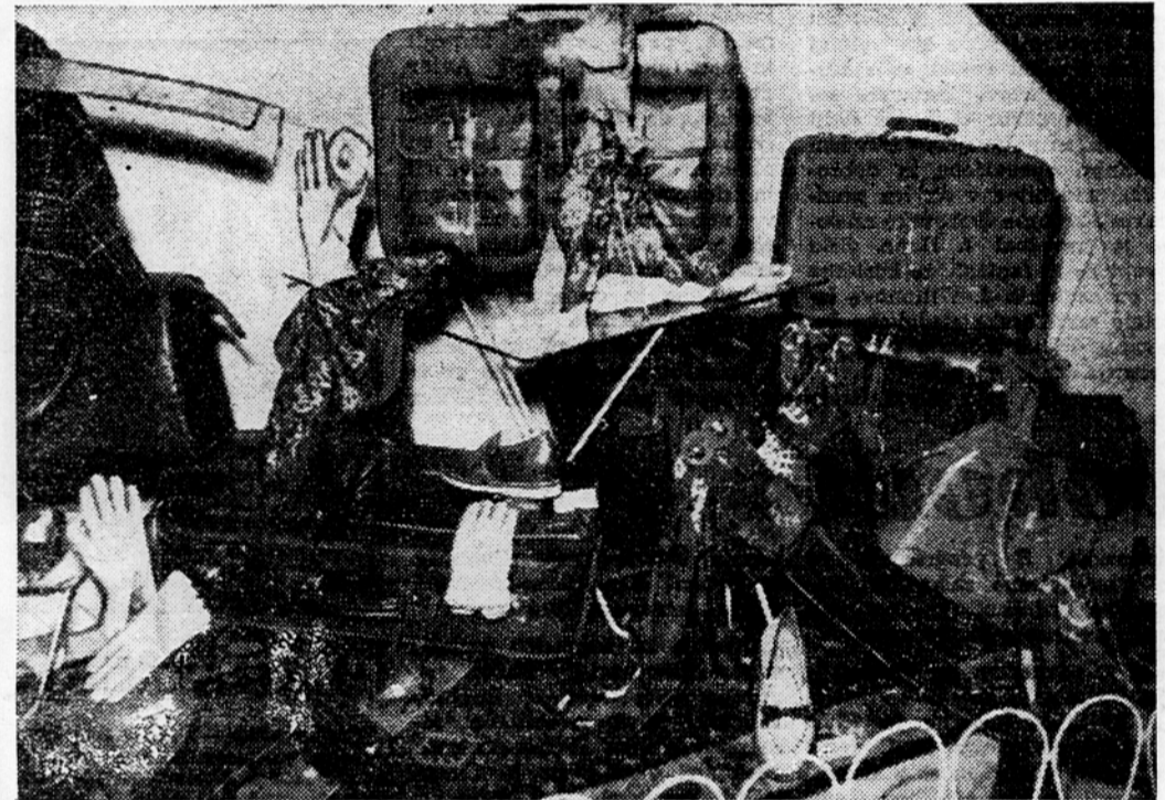
Na razstavi mode v Ljubljani razstavlja trgovsko podjetje »Usnje« med drugim izdelke tovarne »Toko« iz Domžal, ki so dobili visoko priznanje tudi na inozemskih trgih

Posebej je razstavljena moška moda. Tu so razstavljene torbice »Safiana«, pripravne za službena in druga potovanja, kravatne tovarne »Svilanite« iz Kamnika, vse vrste letnega in zimskega blaga za obleke in plašče ter razne toaletne potreb-