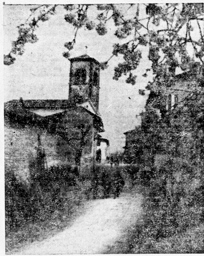
Medana v Brdih, kjer je meja med Jugoslavijo in Italijo odrezala kmetom vsa polja, tako da je na naši strani kar 107 dvo-lastnikov

Brici z veliko zaskrbljenostjo gledajo na delo komisije, ki je bila ustanovljena na osnovi določb mirovne pogodbe in ki mora začrtati mejo med Jugoslavijo in Italijo, pri čemer lahko v pogodbi določeno mejo korigira za 500 m na eno ali drugo stran. Sedaj je komisija zopet v Brdih. Ljudje so v skrbeh in pravijo, da ne sme niti košček slovenske zemlje več pripasti Italiji. Med Brici so se raznesle govornice, da hočejo Italijani, da bi meja pri Medani tekla ob cesti, ki pelje v Neblo, tako da bi gradič Ceglo ostal na italijanski strani. Brici so zaradi tega zelo razburjeni. Ze res, da je lastnik gradiča in posestva Italijan, ki živi v Trstu, toda on ni nikdar živel v Brdih, zemljo so mu vedno obdelovali slovenski koloni. Med vojno je bilo 11 članov teh kolonskih družin v partizanih. Poleg tega je pri gradu tudi studenec, ki daje vodo skoraj vsej Medani. V Brdih je namreč veliko pomanjkanje vode in bi bili kmetje zelo prizadeti, če bi izgubili še ta studenec in bi morali vodo dovažati iz več kilometrov oddaljenih krajev. Na italijanski strani pa je voda dovolj. Prebivalci Medane so zaskrbljeni tudi zaradi ceste iz Medane v Neblo, katero sedaj seka meja in je ne morejo uporabljati. Kmetje, ki imajo zemljo na oni strani meje, se zelo pritožujejo, ker