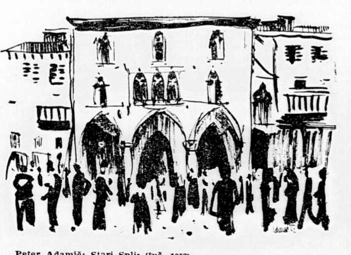
Peter Adamič: Stari Split (tuš, 1952)