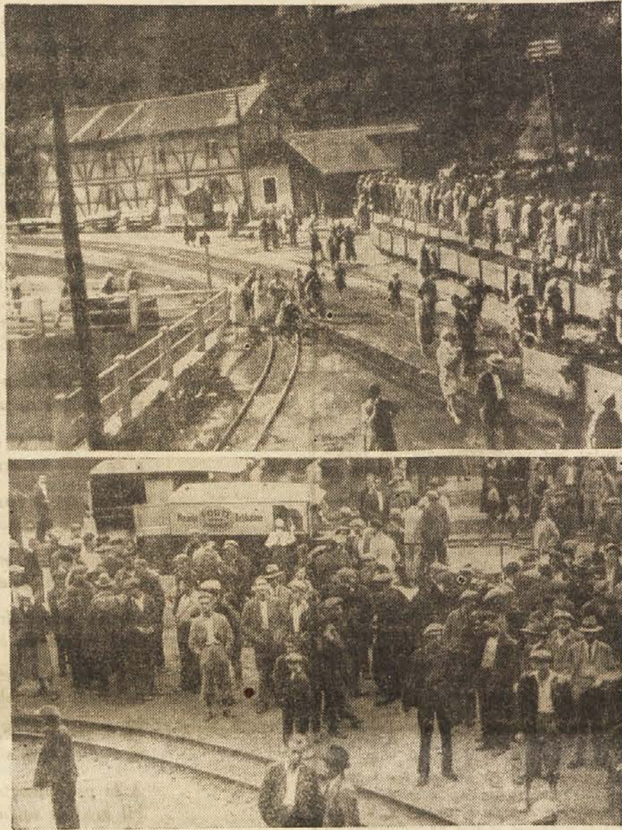
Svoji rudarjev čakajo med gladovno stavko pred vhodom v rov

tudi kolektivno pogodbo, ki jo je podpisala in se zavezala držati jo. Pogodba je predvidevala trimesečni odpovedni rok in bi jo smela prekiniti s 1. oktobrom; družba pa je šla preko vsega in jo prekinila že kar s 1. julijem. Izstradani in obubožni revirji se zamajejo. Rudarji ne čakajo več na pogajanja, ne nasedajo več niti nemu, niti drugemu. Pade zavesa, ki je ločila rudarje v posamezne skupine, in enotno začno svojo odločilno borbo, po svojem načinu pri nas povsem novo in prvo te vrste. Dne 3. julija se rudarji več ne vračajo iz rovov. Zasedejo rove, rudniške naprave in delavnice ter vsak na svojem mestu čakajo brez hrane, pri-