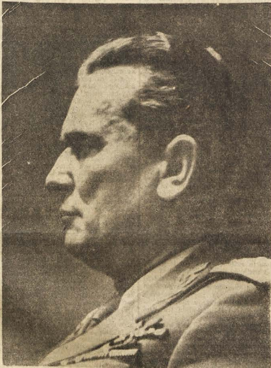
Tovariš Tito — generalni sekretar Centralnega komiteja KP Jugoslavije

k fašističnim silam, je bila Partija pripravljena in je ljudstvo pod njenim vodstvom prisililo vlado Cvetković-Maček, da je odstopila. »Tisti dan, pravi tovariš Tito v svojem poročilu na V. kongresu