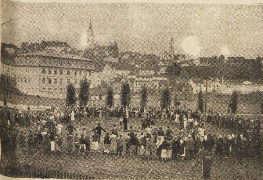
Stavkajoči delavci plešejo pred tekstilno tovarno »Jugočeška«

Stavkovni odbori so nastopali v tovarnah kot organ oblasti. O vseh pogajanjih in mahinacijah kapitalistov ter njihovih priganjajev so bili stavkajoči vsak dan obveščeni. V tovarnah so se vršila vsakodnevna zborovanja. Na znak