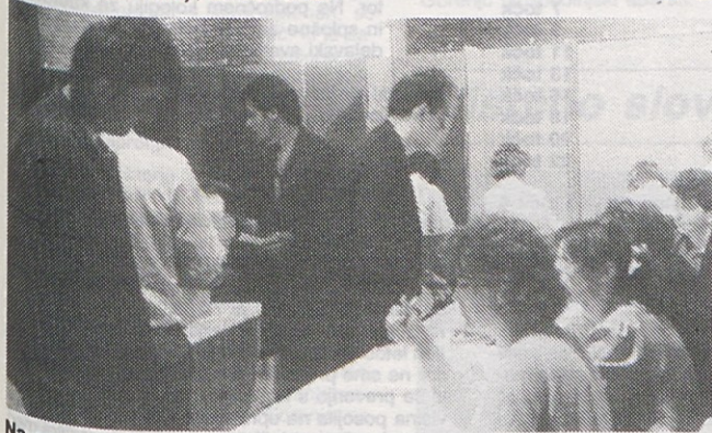
Na enem izmed volišč v Gorenju Gospodinjski aparati