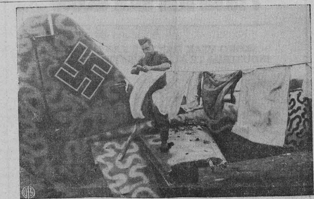
Nemško letalo je priletelo tako nizko nekdaj na italijanski fronti, da so si ga privoili naši fantje. Letalo je ostalo v takem položaju, da ni bilo za drugo rabo kot le zato, da so ga porabili mesto kolov in so napeli preko njega vrvi za sušenje perila. Na sliki vidimo vojaka, ko ravno obeša svojo "žekto."