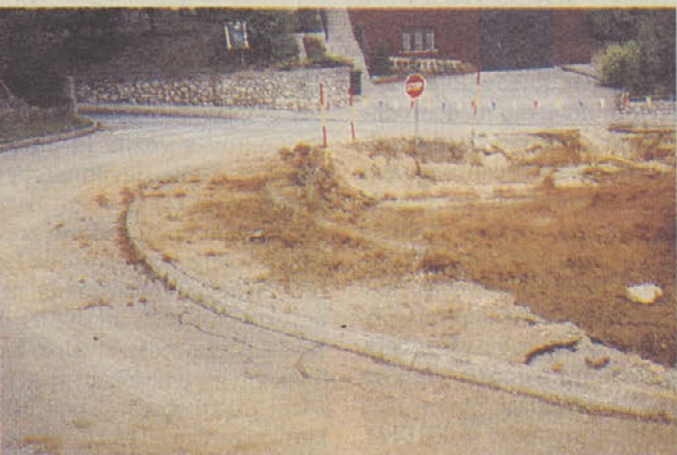
V poletnih mesecih se je spremenil v gradbišče dovoz do OŠ Trebnje, ki je bil vsa leta ozko grlo pri srečevanju šolskih avtobusov in osebnih vozil in zato izredno nevarno.