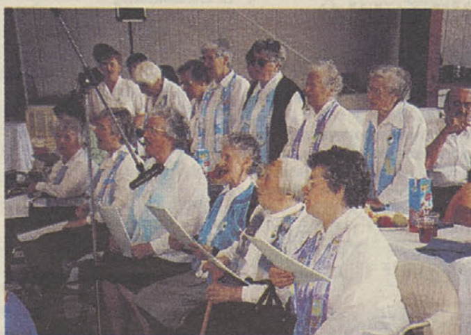
Vesele Trebanjke - pevke DSO Trebnje.

Glede na to, da je dom v Trebnjem odprt od leta 1999, tudi zborovsko petje v domu še nima tradicije. Stanovalkice so začutile potrebo po