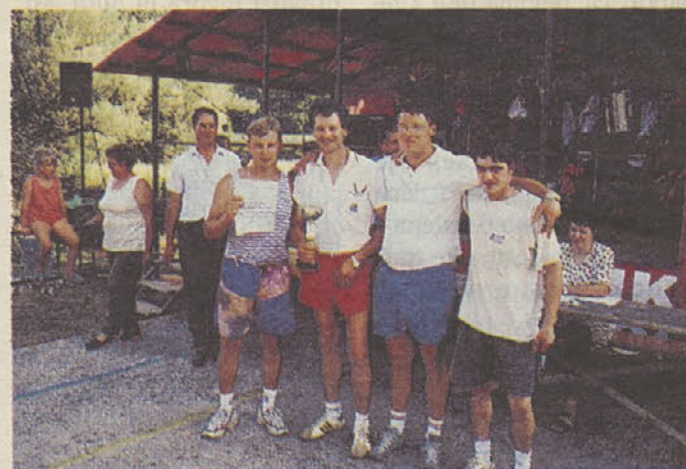
Zmagovalna ekipa iz Jezera.

Že ob dveh popoldan smo imeli začetek tekmovanja med vami. Udeležilo se ga je enajst ekip (KS Dol. Nemška vas šteje 13 vasi). Vsaka ekipa je štela štiri tekmovalce. Tekmovanje smo vzeli malo