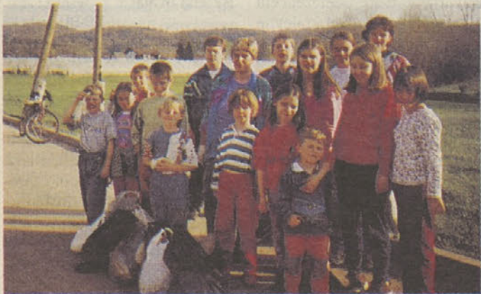
Čistilna akcija april 2001

Tako kot vsako leto smo se tudi letos odločili očistiti našo vas, Grm. Glede na to, da se vsi v vasi zavedamo, kako pomembno je varovati naše okolje, nismo pričakovali prevelikega dela. Pa so nas nekateri predeli vasi zelo presenetili, in sicer glede na število odvrženih odpadkov. Predvsem smo veliko nabrali ob poti, ki pripelje v vas do pokopališča. To vodi k