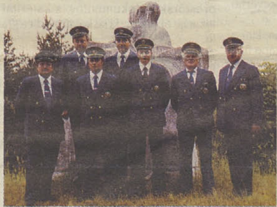
Del udeležencev trebanjske ZŠAM na 29. evropskem kongresu v Dornbirnu

Na občnem zboru 18.3. se je 50 prisotnih udeležencev zaustavilo ob doseženih rezultatih in ob aktualni problematiki. Tako so ugotovili, da občina v prostorskih izvedbenih aktih parkirišč ne planira in da se pojavlja na tem področju vse več nedovoljenega in neprimerne parkiranja. Opozorili so tudi na zgostitev prometa skozi Radohovo vas po vključitvi novega odseka avtoceste in odprtja cestninske postaje na Dobu. Mnogo voznikov se v Biču ali že v Ivančni Gorici z avto-