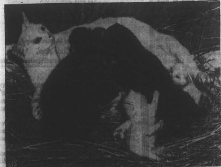
Mlečne mučke imajo kaj malo prilike priti do materinega mleka, ker so se pri njih materi domočili mali črni panterji. Mali panterji so bili rojeni v Sarasoti, Fla. Njih mati spada k Ringling Bros. cirkusu in ker so se bali da bi jih ova morda ubila so jih dali v rejo domači mački, ki je tudi istočasno imela svoje mladiče, za katere pa skrbijo cirkuski delavci, da ne stradajo.

MILES LABORATORIES, INC. Elielhart, Indiana